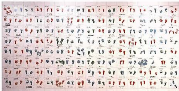
海岸線10駅の壁面を2000年生まれの子供たちの手形と足形で飾る