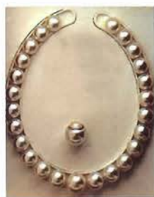
世界最大級23ミリの南洋真珠

オーストラリア、タヒチ、中国、インドネシアなど世界各地の産地から真珠が生まれています。多様化する真珠産業に業者それぞれが対応していかなければなりません。神戸は昔から港まちとして発展してきました。今後国際都市として発展していくためには、国際的な競争に勝つためのシステムが必要。