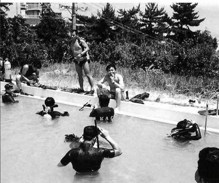
1977年、寺本家のプールでダイビングの練習をする神戸アクアラングクラブ会員たち