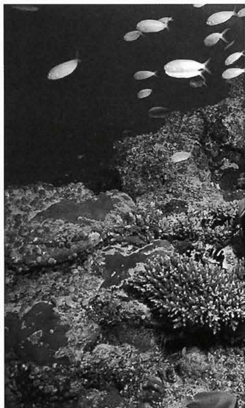
海底パラダイス、色とりどりの魚を見つめていると時間が止まったよう

寺本 昔は潜る回数を数えることをしなかったんですよ。それで、数え始めてからだ、いままでで200本ぐらい潜ったと思います。何本っていうのは酸素ボンベの数をいうんですけどね。だいたい2か月に1回ぐらいを目標にしているんですよ。我々の歳になったら後何年で、なにができるかということを考えるんですよ。せいぜい太平洋の島を全部行けたらいいのになあって、ささやかな望みをもっているんですよ。若いひとにしたら、ええなー、といわれるけど僕は肝心な大きな望みがないか