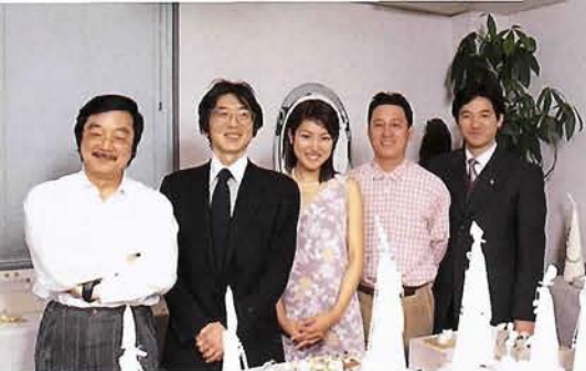
(有)イソワパールイーストにて