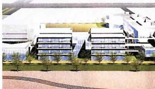
2002年春に誕生する神戸国際大学の新学舎

想です。旧約聖書は「エデンの園」からはじまり、新約聖書の「エルサレム」という都市で終わります。また聖書の中に「山が海の中に移る」という言葉があり、垂水の山側から六甲アイランドの海際に移転する本校にぴったりの言葉だと思っています。「ヒューマニティ」（創立以来のキリスト教主義に基づく全人格教育）「コミュニティ」（地域、社会に開かれ、共に歩む）「グローバルティ」（グローバルな視点に立って、地元・神戸から世界へ向けて情報発信）の3つの基本コンセプトを基に、この超都市型大学の理想を掲げて、新しい世紀にふさわしい活気に満ちた学園づくりをめざしていきます。