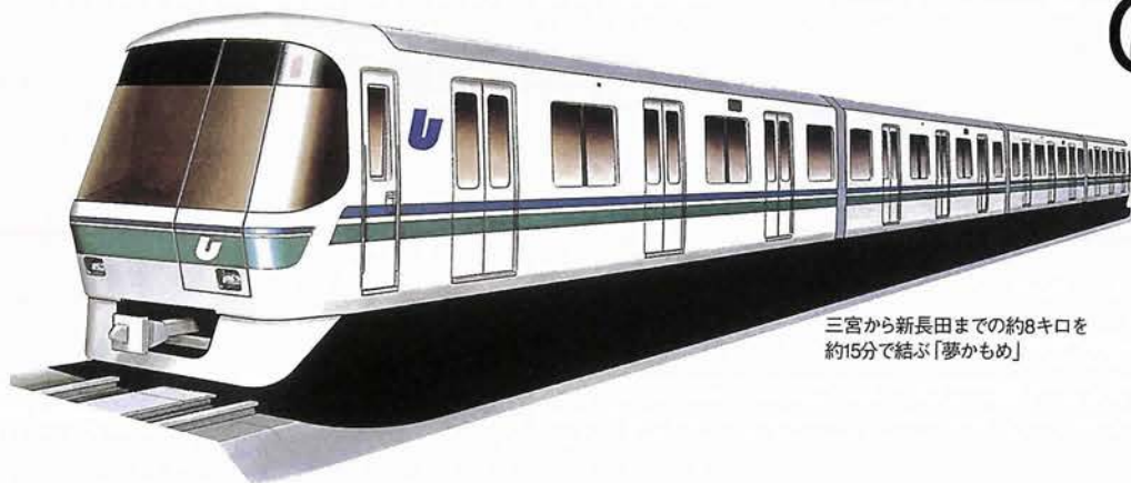
三宮から新長田までの約8キロを約15分で結ぶ「夢かもめ」