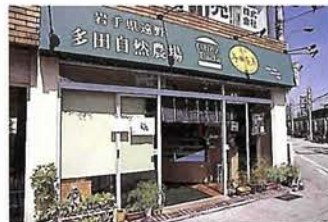
摂津本山駅から徒歩10秒！ 緑のテントがおいしさと新鮮さの目印

神戸市東灘区岡本1・6・12 ☎078・411・6888 11:30～14:00 17:00～午前2:00 （日・祝日は11:30開店）／無休