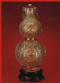
金鑲空葫蘆式香薰(清代)