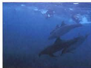
野生のイルカたちとの出会い