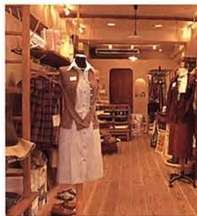
キュートなフレンチカジュアルがそろっている

が伝わるアクセサリなど、オーナーの趣味とセンスが反映されたワイルドワイドなものが魅力。かわいくなって、実用的でもある食器がいろいろ。行って、見るだけでも価値有り！