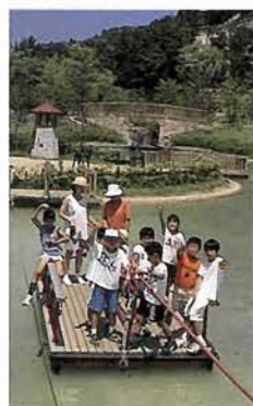
トリム園地のなかのイカダで冒険

この3つのキャンプ場で最も便利なのは、バーベキューセットの材料や食料、日用品など売店で売っていることだ。レンタル品も揃っていて、ランタン、毛布、シユラフ、フロアーマット、タープ、パラソル、鍋ま