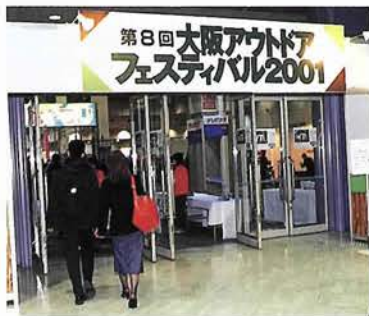
大阪南港インテックス大阪にて開催。 多くのアウトドアファンで賑わった

キャンプ場ブースの周辺には、テントやアウトドア仕様の衣類・調理器具などの「定番グッズ」即売ゾーン、アウトドア・アウトレットが設