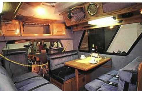
ゆったりとくつろげるようになっているキャンピング・カーの内部

多くのキャンピングカーの中で特に異彩を放ったのが、「トレーラーハウス」。外観はよく映画でみかけ