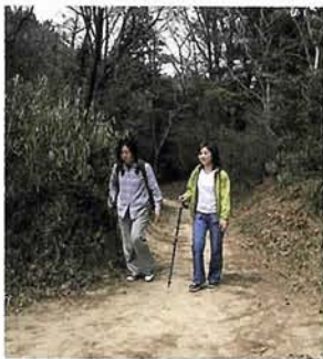
帰り道は杖をついて。これ1本あるとけっこうラクなんです