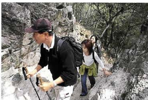
けわしい岩場も、自分のペースでゆっくり登れば平気。鳥の声や森林浴を楽しみながら

つは必ず地についていること。これがロッククライミングの基本。三点確保。つるつるで足場がなさそうな岩場でも、その基本さえ押さえしていればなんとか登れる。ふと周りを見渡せば、ヤマザクラやアシビ、コバノミツバツツジが花を咲かせて