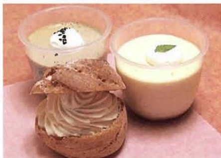
柔らかくて濃厚なゴマプリン、カスタードプリン（各250円）と牧场シュウクリーム（150円）。売り切れごめん！