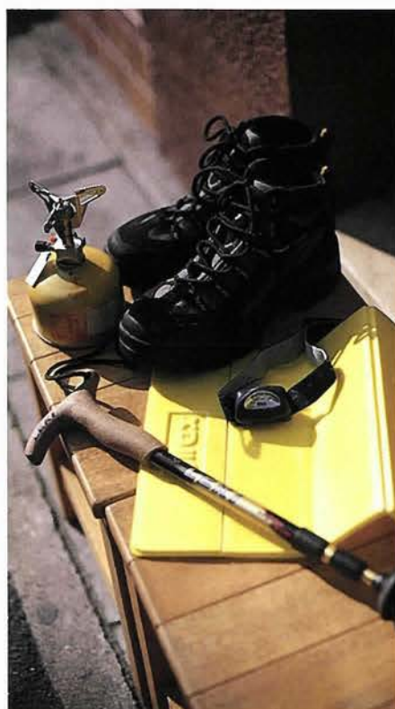
登山・アウトドアグッズはすべてそろそろ。愛用品を見つけたい

神戸市中央区琴の緒町5-7-5 ☎078-265-2045 平日10:30～20:00 日祝10:00～19:30/無休 山行き・釣り行きの前にアクセスしよう http://www.kojitu.co.jp