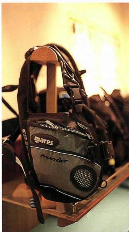
ダイビング器材を買うときもきちんと相談にのってくれる