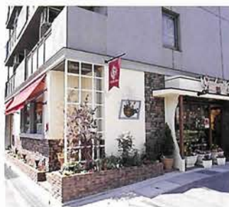
クリーム色の壁に花が映える

も手頃で、買いやすいと地元でも評判。人気のハニーロール（400円）は岐阜県のレンゲの花の蜜を使用していてシンプルなおいしさ。夏にかけてオリジナルゼリーも発売予定。