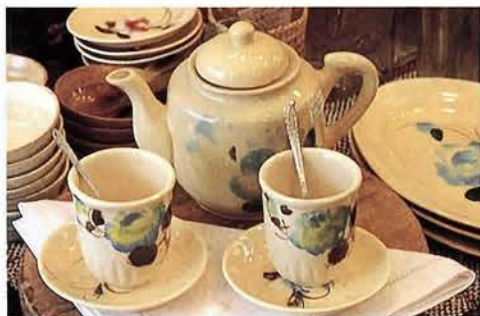
ベトナム産食器。ポット680円、コップ180円、小皿100円、大皿300円。セットでそろえたい！

店に入ると壁一面にグラスが並び、一見愛らしい女の子のための雑貨屋か？と思うが、奥に入ってみると、アメリカンアーミーのボーイズグッズがあったり！ まったく違うテイストのものがこの店だと不思議と調和している。 「リーズナブルで、ちよつとした気分転換のために使える商品」と、アジアンテイストな布や衣服、大地の香りがしそうな器や、手づくり感