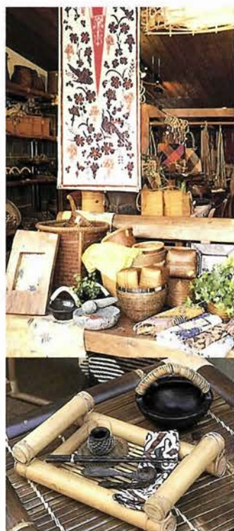
涼しげなバンブートレー (1200円)。食卓にも、ちょっとしたインテリアにも