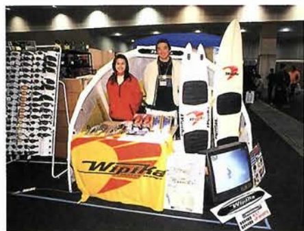
空力を利用し、風の要領で海上を駆けるエア・ブラスト

う工夫が施されている。新製品は何もデジタルなものばかりではない。ネイティブアメリカンの知恵が生んだ、内部で火が使用できるテントなどのアナログなものもあり。これらのブースが隣り合っているというのもまた面白い。