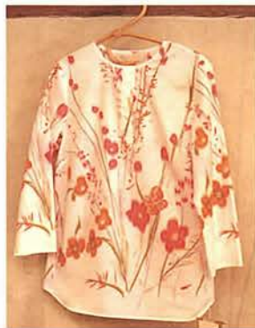
オリジナルブランド「ボンビュータン」の上着15000円

神戸市東灘区本山北町3・6・2 ☎078・411・1450 10:00～20:00 / 木曜休