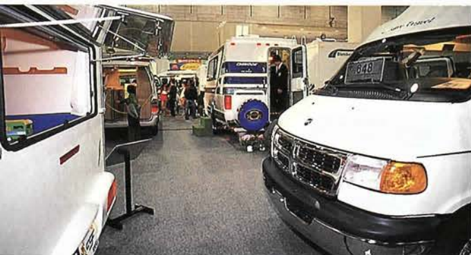
牽引型のキャンピング・カーも多く出揃う