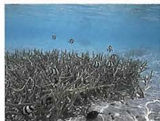
サンゴ礁の中には、多くの魚が住む