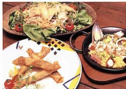
夜は各国の創作料理が味わえる。中国風鯛サラダ800円（上） 海鮮バリエア800円（右） モロッコ風チーズ春巻き400円（左）