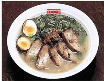
とんこつラーメン（並）600円。 他に特上盛り900円、チャーハン300円など

3月にオープンしたばかりのラーメン店。スープはとんこつ、なのに女性でも最後の一滴まで飲みほしてしまうほどあつさり。麺は国内産の良質小麦を使用した極細麺だ。しかしなんととっても感激はワンタン、