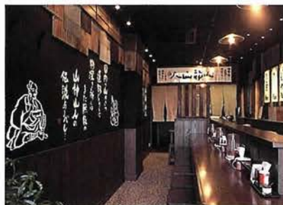
こんな清潔感ただよところでラーメンが食べたかった！

厚さ3ミリ(?)はあるというのに、口のなかに入れると噛む前にとろけて広がる！ おしゃれで明るい店内だから、女性ひとりやファミリーでも入りやすい。