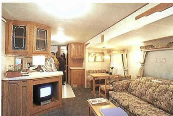
豪華！トレーラーハウスの内装はこんな感じ