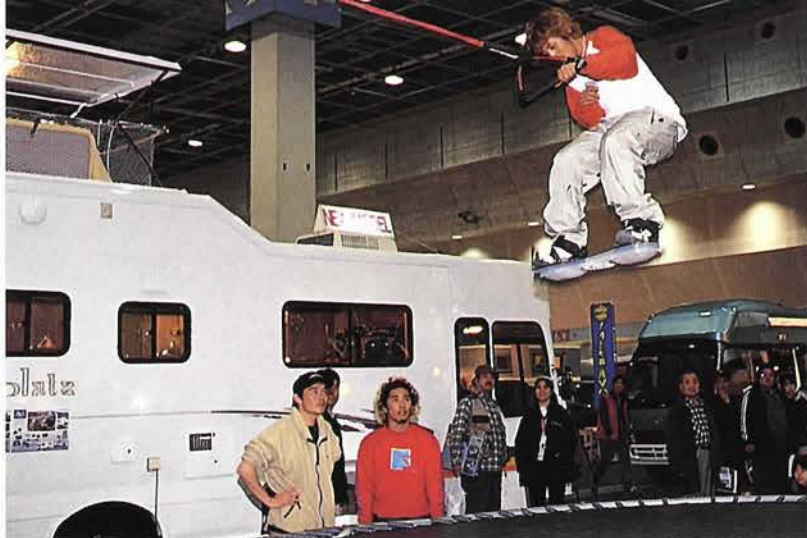
トランポリンを使用したウェイクボードのデモに多くの人が魅了った

「アウトドア」と一口に言ってみたところで、受け取りかたは人それぞれ。楽しみかたも人それぞれ。ビギナーには手ほどきを、ベテランには新鮮な喜びを。そんなイベントを僕らは待っていた。