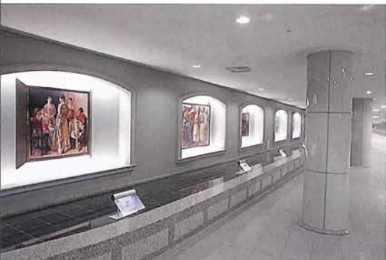
名画の数々が、訪れる人々を魅了する