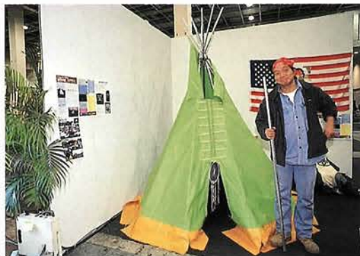
いにしえの人々の知恵が結集した内部で火が使用できるテント