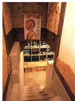
地下にはワインセラーも