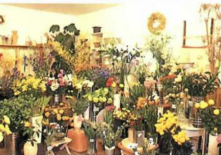
珍しい花も安価で。鉢やガーデニング雑貨のセレクトもナチュラルでかわいい

木づくりの扉をあけると店内には、部屋にそっと飾っておきたくなるような清楚で可憐な花たちでいっぱい。年配の人には懐かしい山野草やヘビイチゴなども素朴でやさしい気持ちにさせてくれる。関西では