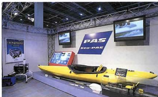
電動自転車の構造を応用して制作された電動カヤック

れた試乗者は、「かなり低い目線で、水面が近く驚いた」と一言。各々が、幅広い遊びの世界の入口へと案内され、醍醐味を肌で感じとっていた。