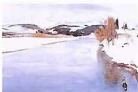
金山平三「大石田の最上川」

三宮・元町地下連絡通路 所在地 神戸市中央区三宮町1-1 お問い合わせは 都市計画局計画部工務課 TEL 078・322・5491