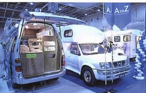
さまざまなタイプが用意されたキャンピング・カー。それぞれに内装も装備も工夫されたものが多い。

「自然と遊ぶ」という姿勢。一旦、アウトドアの魅力にとりつかれると、その視野はどんどんと広がってゆく。最低限のルールさえ守れば、どんなカタチの遊びも許容するフィールドがそこには存在するのである。