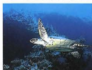
大空を飛んでいるようなウミガメ

は騒音だらけの世界で暮らしている。でも水の中は自分の呼吸の音しかしない静寂の世界。子どもや女性に大人気のイルカに出会う事！だって夢じゃないです。イルカの機嫌さえよければ、一緒に遊ぶ事だってできる。それも野生のイルカ。いくらアフリカの大草原に行っても野生の生き物と遊ぶことなんてできない。ダイビングではそんな夢みたいな事が実現にできる。水中の地形、これも見逃せないポイントだ。色とりどりのサンゴが広がる明るい海があれば、チョップリ冒険心をくすぐるトンネルやアーチがあったり。いきなり絶壁のようにストーンと何百メートルも落ち込んでいるところもある。ほんとに変化に富んでいる。私自身、底の見えないようなまっ青な空間にふわりと浮いている感覚が大好きだ。ダイビングしていて、よかったなあとと思う瞬間であり、この感動をひとりでも多くの人々に味わってもらおうと生まれたのが指導団体。どんな事でもまず基本が大切。車の免許と同じように、まず自分の命を守る方法をしっかりと学ぶ必要がある。自分のペースで自宅学習し、解らないところをインストラクターと復習。そして、プールで基本を練習する。ここまでくれば、もう一歩、旅行気分で行くだけ。海ではサカナたちを見ながら、プールで練習した事をゆつくりと復習する。2日間で4本潜れば、ダイバーの仲間入り。あこがれのライセンスカードが手に入る。これさえあれば、世界中の海がフィールドになる。一歩踏み出して、感動半径を拡げよう。