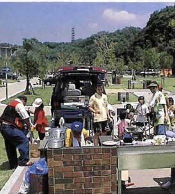
大勢で楽しめるのもオートキャンプならでは

キャンプスペースにテントを張ってもいいし、車のリアドアやサイドドアを利用してタープを張ることも可能だ。キャンピングカーをはじめワゴン車、乗用車など、どんな車でもOK。45のサイトには、流し台、水道、炉、家庭用電源が備え付けられているので、初心者でも簡単にオートキャンプの体験ができる。