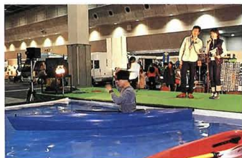
中央ステージ前のプールを利用して、カヤックの試乗会も随時行われた

要なく、持ち運びも可能という点が大きな特徴である。また、すべてが電気で作動するというわけではなく、あくまでアシストとして作用するとい