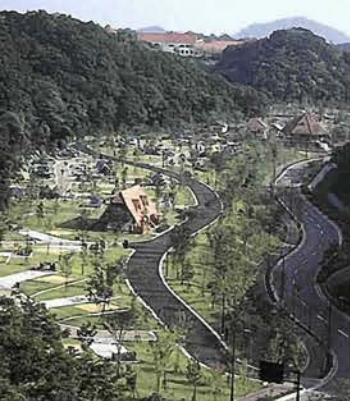
四方を山に囲まれたオートキャンプ場