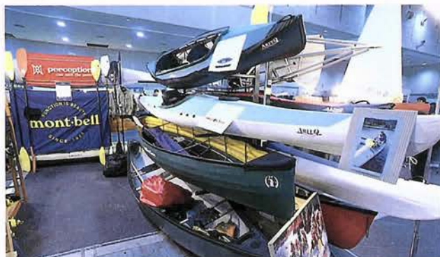
カラフルなカヤックの数々