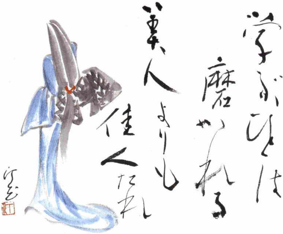
書・画／四井汀花 ※「佳人」内面からにじみでる美しさをもつ人