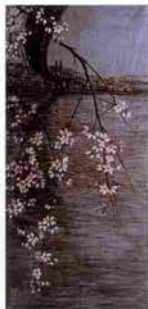
「暮れゆく海浜」 1999年・豊田祥比三画

生徒さんはまったくの初心者から、本格的に絵画の道に進む方も一堂に集まり、楽しく自然の風物を描くのがこの教室です。折々の美しい風景や花鳥など、日本の心を描いてみませんか。初めての人は簡単な水墨画からはじめるのもいいかも。