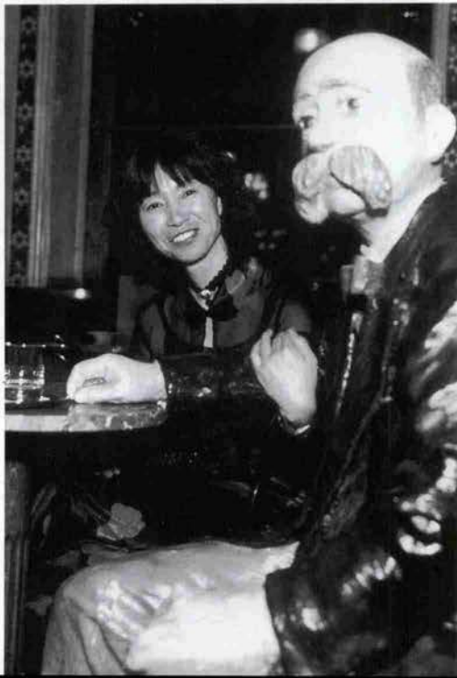
カフェの常連・詩人のアルテンブルク。カフェ・ツェントラルにて