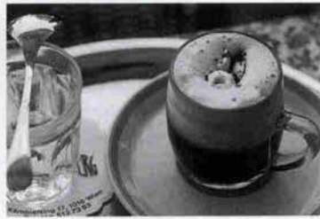
(左) 洗練されたウィーンの洋菓子 (右) ご存知ウィннаコーヒー