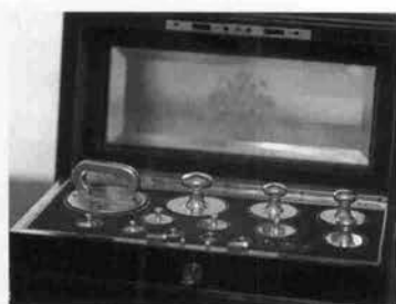
エリザベートのダイエット用分銅