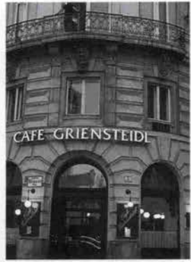
100年も続くカフェがいたるところに

市民が気取ったサロンに奥深く閉じこもるのではなく、街に出て、大いに語り、伝え合う場として、カフェが大きく貢献した。ミュージカル「エリザベット」でも、政治をめぐって議論する市民が集まるカフェに、死の帝王トートがまぎれこんで入れ知恵をするというシーンがあったが、カフェはウィーンっ子にとってまさに生きたマスメディアでもあったのだ。