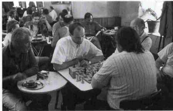
カフェは人生の一コマ

ちなみにその由来は、十字軍の遠征によりトルコからコーヒー豆がもたらされコーヒーが大流行したことによる。現在のカフェの原型はすでに十八世紀には形成されていたらしい。ペーター・ベンもカフェで過ごす時間を大切にしたり、ヨハン・シュトラウスはみずからカフェでコンサートを開いたというから、今から思えばすごいことだ。十九世紀末になると、音楽家に限らず、文士や画家、建築家などが常連としてカフェに集まった。中には詩人のアルテンブルクのように、手紙の宛て先までもカフェ・