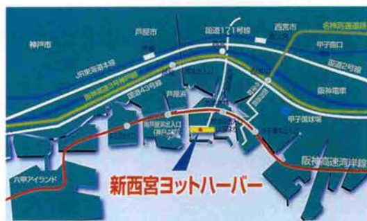
新西宮ヨットハーバー

第1回南紀ビッグファイトトーナメントは、1位「パビヨン」113キログラム、2位「光成」87キログラムの成績で幕を閉じた。