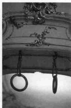
エリザベートが使った体操器具

宮殿には彼女がその美貌とスレンダーな体型を保つために作らせた体操の器具や、ダイエット用に綿密に食物の量を計らせた天秤、分銅などが残っており、美を保つことに賭ける彼女の並々ならぬ想いが伝わってくる。