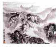
墨の濃淡とにじみが出た独特の美しさをかもし出す水墨画。吉織先生作品

水墨画本来の流れであり、今世界で注目を集めている現代中国画を基礎から学べる希少な教室。花鳥・山水の色紙作品から大型作品まで、上達すると自作を家に飾ったり、展示会に出品したりと学ぶ喜びも増える。一枚一枚先生の書きさという練習見本からも丁寧な指導がわかる。