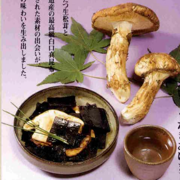
生松茸昆布 ご進物用1000円より(100g480円)

香りたつ生松茸と 北海道産の最高級白口真昆布 厳選された素材の出会いが、 究極の味わいを生み出しました。