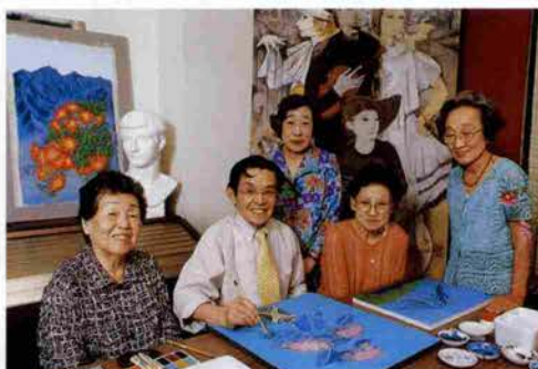
気さくな豊田先生との会話も楽しい