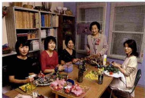
結納飾りを2人のお部屋のインテリアとしてリフォームしてはいかが