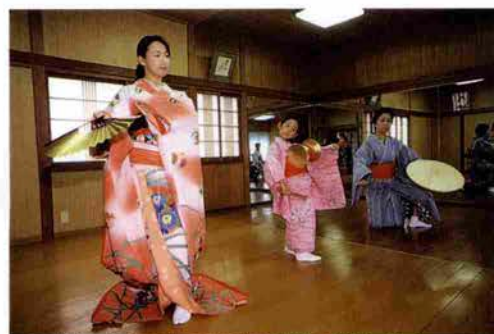
11月の公演に向けてしあげの稽古に汗を流す生徒さんたち