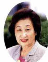
色とりどりの花と楽しみながら新しい自分を見つけましょう。

あざやかな美しい花びらの色・形・かおりをそのままに、オリジナルドライフラワーのクリスマスリースやブーケ、コサージュをつくりませんか。庭先の花などもアレンジ次第。シリカゲルやワイヤー・グルーガンを用いて簡単につくれます。結納飾り（実用新案申請中）も大人気。