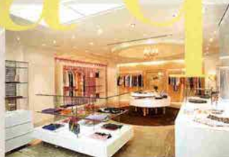
↑オリジナルのアクセも豊富な2Fフロア。奥はインポートのセレクトがそろう

→色とりどりのキャミソール、かごバッグ、ミュールたち。クロス のディスプレイがユニーク