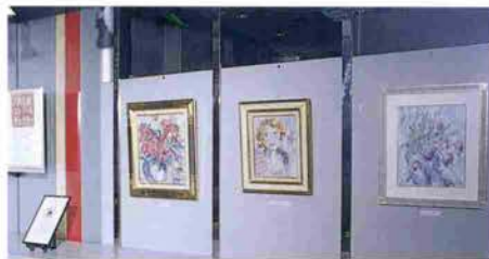
生田新道に面したストリートギャラリー

この“かんしんストリートギャラリー”も芸術の香りをほのかに漂わせたアートスポットとして、本年は「花と人と街と」と題したシリーズで様々な作品を紹介してまいります。