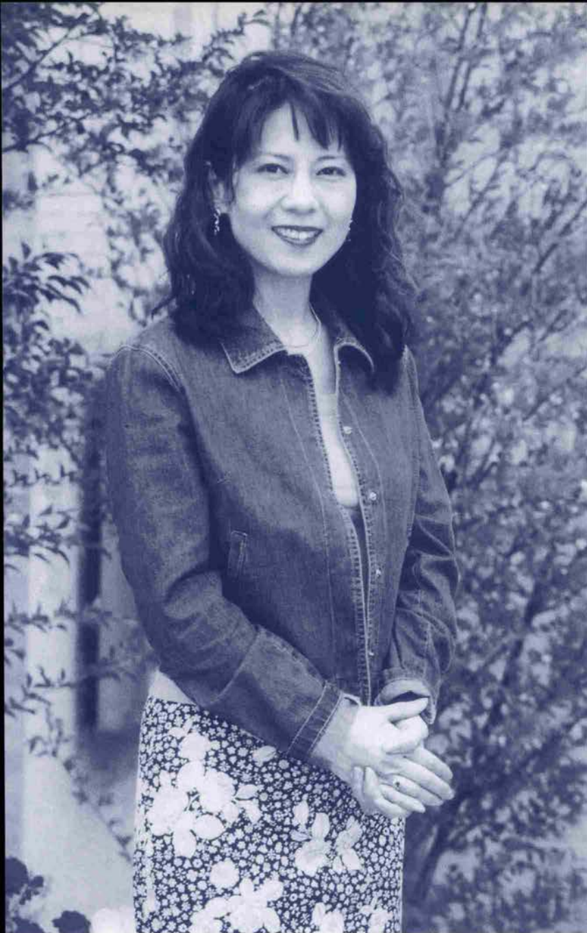
芦屋ルナホール

五月十三日、十四日に神戸アートビレツジセンターで開かれた第一回神戸ジャズヴオーカルクイーンコンテストで、全国約四十組のなかから栄光を勝ち取った。