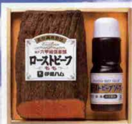
ローストビーフ(もも) / ローストビーフソース