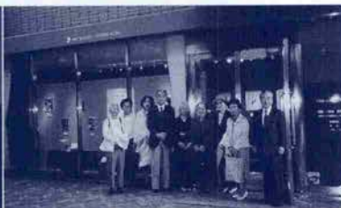
←東山魁夷画伯1周年 5月1日より神戸クリスタルアートサロン(柏木正博会長)で始まった東山画伯の展覧会。画伯のスケッチ風景や遺品も飾られ、東山すみ夫人も感慨深くウィンドウを。6日に奈良の唐招提寺で1周年。鑑真和上と同じ6日が命日と、ご縁が深い