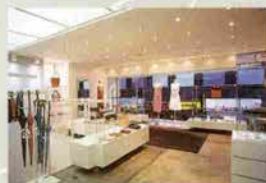
↑ディスプレイも常にトレンドを意識。お手 本にしたいコーディネート