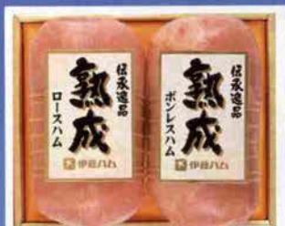
伝承逸品 熟成ロースハム / 伝承逸品 熟成ボンレスハム