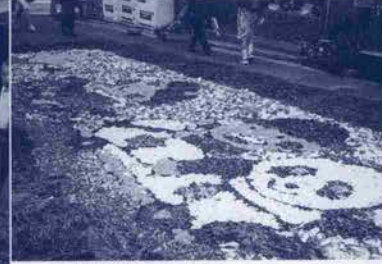
←穴門商店街会場にはかわいいバンダ(写真上)や關帝廟(写真左)の力作花絵も