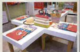
↑まだまだ大人気のピンク。次はグリーン が強いだとか

クリスタル、透明感、ポップ、きれいな色がい ま話題の「アキアガール」のイメージ。つねに 時代の先端をいくスタイリングの提案をして くれるセレクトショップ。 「クロール」ジューススタイルのオリジナルブラン ド「カトリヌ・マランドリーノ」「エミリオ・オ ッパ」「サムソナイト」など、きれいなライン十 ハードアイテムでこの夏の流行を先取り。ア クセサリ、バッグ、シューズも昔っぽくて新 鮮。