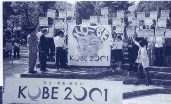
←神戸21世紀・復興記念事業シンボルマーク決まる 2001年に始まる復興記念事業の愛称・ロゴ・シンボルマークのお披露目式が、5月9日に東遊園地で開催。愛称「KOBE2001 ひと・まち・みらい」は応募作品数点の合作。シンボルマークはアーティスト日比野克彦さん(写真左下)の作品。輝く目と語り継ぐ口をもつ「5~6才」子供のイラストだ