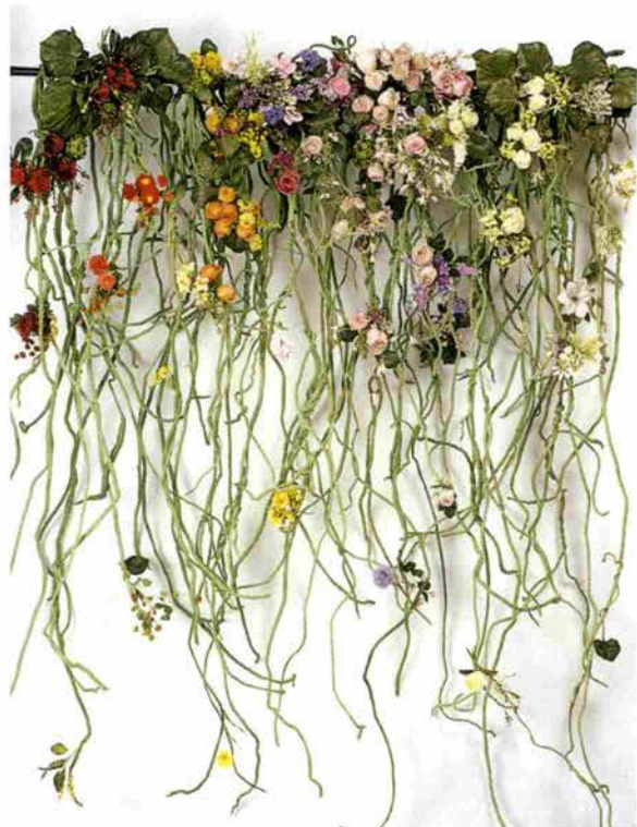
おもい出の中の花達