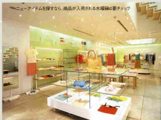
→ニューアイテムを探すなら、商品が入荷される水曜日は要チェック