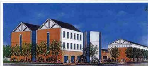
社会文化学部新校舎完成予想図(伊丹キャンパス)