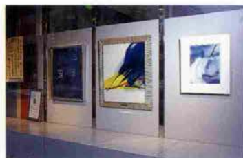
生田新道に面したストリートギャラリー

この“かんしんストリートギャラリー”も芸術の香りをほのかに漂わせたアートスポットとして、本年は「アート&クラフト'99」と題したシリーズで様々な作品を紹介してまいります。