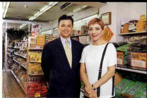
南京町廣記商行にて