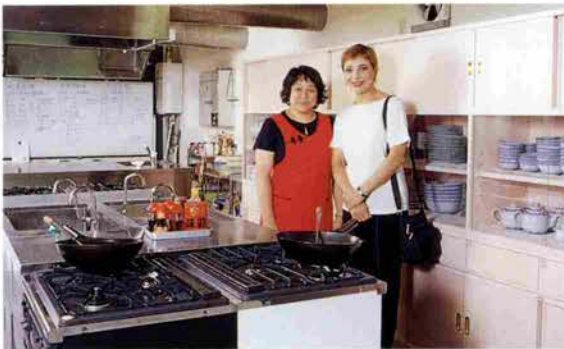
お料理教室会場にて奥さまと

鳳 千田是也記念「ブレヒト・オペラ」で11月6日、7日、9日神戸文化ホールに来ます。あとは宝塚ホテルでのディナーショーなども。