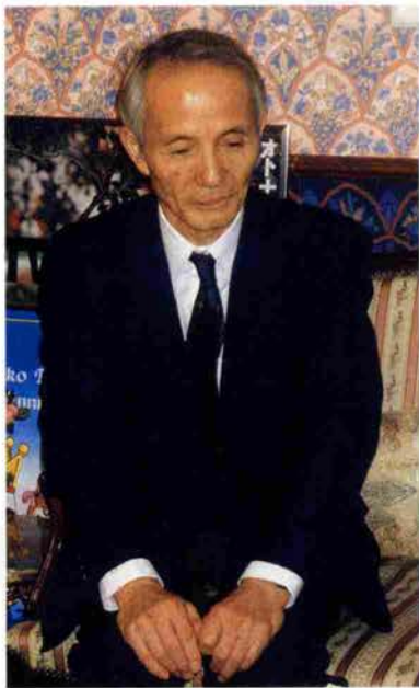
よねやま・としなお

1930年奈良生まれ。京都大学大学院博士課程修了。農学博士。94年京都大学名誉教授。放送大学教授、日本学術会議会員を経て97年より現職。文化人類学専攻、比較文明学にも貢献。99年紫綬褒章授与。