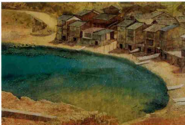
西田眞人「碧い入江」