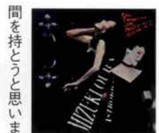
10月発売 ライブCD「Che Tango 99 LIVE Piazzolla～3001年への プレリュード」 日本クラウン2500円

芝居の中の軽みって貴重だと思うんです。そういう気持ちがあったせいか、どちらかと言えば、これまでコケティッシュなキャラクターに片寄っていたんですが、「ワルツが聞こえる」は映画の「旅情」のブロードウェイ版です。キャサリン・ヘップバーンの作品をやってみたくて、この人のものを、という思いでやるのは初めてです。彼女のシンプルな、女優、女優していない生き方に惹かれます。ストリートでサバっとした感じですよ。ちよっと大人の女性が演じられそう。今年、これまでの中で一番フル回転だったので、一度、ハングリーな状態に身を置こうと思っています。これまでやってきたことの隙間を埋めて積み直すっていうか、声を出す、踊るといった基本的な部分で、身体をもう少し作り替える時