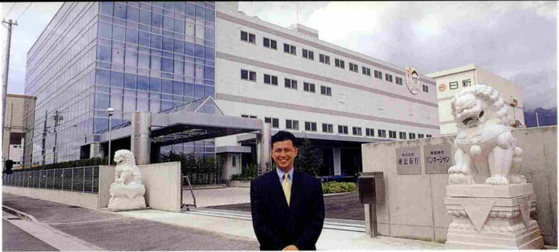
麻耶埠頭に完成した営業センター。全国に食材が発信される

料理ってなんでも食べるでしょう、よくいいですよ、空飛ぶものでは飛行機、4つ足のものではテール以外なんでもいただいでしまうとか(笑)。