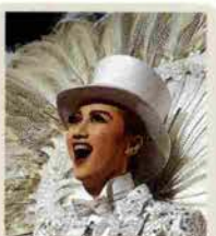
星組宝塚大劇場公演 11月8日まで 「我が愛は山の彼方に」 「グレート・センチュリー」 S席7500円 A席5500円 B席3500円