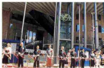
4月29日、神戸国際会館オープニングのテープカット

には、富永直樹氏作のブロンズ像「美しき神戸のメロディー」、2階エントランスには、新開寛山の陶壁画「森の歓喜」など一級の美術品がそろう。名誉館長には、世界的な指揮者朝比奈隆氏が就任。5月28日の「こくさいホール」柿落とし公演では、朝比奈氏率いる大阪フィルハーモニー交響楽団はじめ、国内外からビッグアーティストが続々とやってくる。