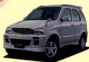
キャミQスタイリッシュパッケージ (4AT)