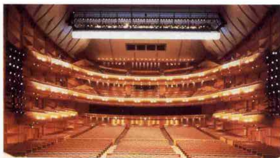
2022席を誇る「こくさいホール」

美術・芸術・文化・情報の発信基地として 5月28日にグランドオープンした「神戸国際会館」。6月1日からは、いよいよ「こくさいホール」が本稼働する。クラシック音楽から演劇、バレエ、日本舞踊に至るまで幅広い催しに対応でき、総客席数も2112席と関西でも屈指の広さを誇る。緞帳「新生の樹」は、先日世界した日本画の巨匠、東山魁夷画伯の作。6階エントランス