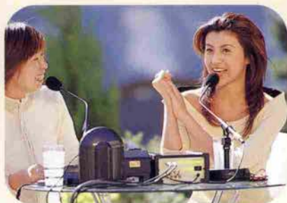
Kiss FMの公開放送「神戸国際会館オープン記念ウーマンリレートーク」でのひとこま

神戸が震災に見舞われて、三カ月後に上京することになりました。あの時に、人から教わったことや自分で感じたことがパワーやガッツになって、東京でも頑張ることができのだと思います。私自身、中、高、大と神戸の学校に十年間通っていましたから、いつも私の心の中には神戸のことがあります。神戸に青春のすべてが詰まっていると言ってもいいほど。だから神戸に戻って来れば、「ただいま！」って気分になりますね。それから