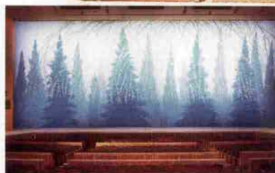
緞帳「新生の樹」(東山魁夷画伯作)