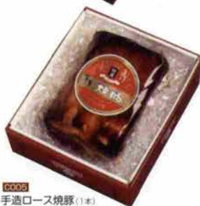
C005 手造り焼豚 (1本)