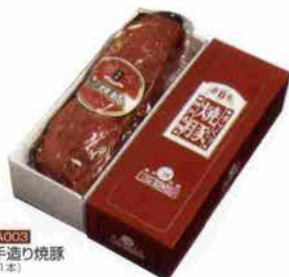
A005 手造り焼豚 (1本)