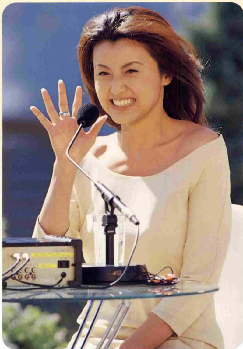
第一声「ただいま！」と一般視聴者の声援に笑顔で応える。数々の神戸の思い出などを披露した