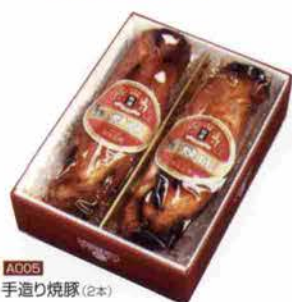
A005 手造り焼豚 (2本)