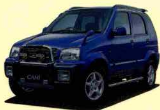
キャミQフィールドパッケージ (4AT)

女の子ってカッコイイクルマに乗りた〜い！ というところまでステキなドレスアップした クルマまで用意しました。