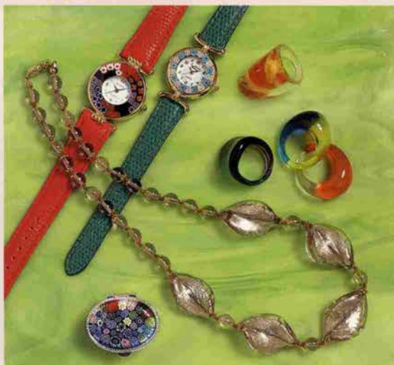
●ベネチアンアクセサリ各種（イタリア） 本場イタリアからベネチアンガラスアクセサリ&時計、ニューアライバルで続々登場...