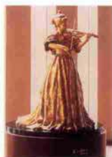
ブロンズ像 「美しき神戸へのメロディー」

には、富永直樹氏作のブロンズ像「美しき神戸のメロディー」、2階エントランスには、新開寛山の陶壁画「森の歓喜」など一級の美術品がそろう。名誉館長には、世界的な指揮者朝比奈隆氏が就任。5月28日の「こくさいホール」柿落とし公演では、朝比奈氏率いる大阪フィルハーモニー交響楽団はじめ、国内外からビッグアーティストが続々とやってくる。