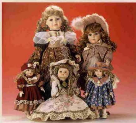
●ビスケット人形各種

神戸市中央区三宮町3丁目9-8 TEL.078-331-5756 FAX.078-321-0173