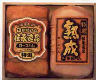
伝承逸品 特選ロースハム／伝承逸品 特選熟成ロースハム