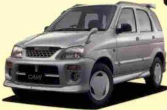
キャミPスポーティパッケージ (4AT)