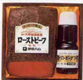
ローストビーフ(もも)／ローストビーフソース