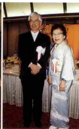
文化庁長官・林田英樹氏と