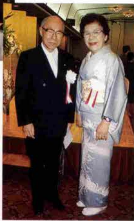
文部大臣・有馬朗人氏と