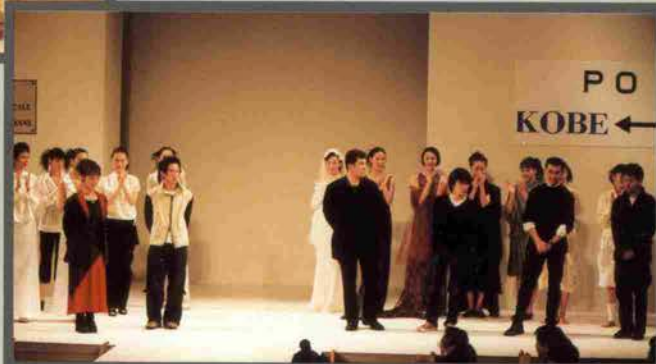
↑神戸ファッションコンテスト'98開催

第25回神戸ファッションコンテスト'98が11月14日、神戸ファッション美術館オルビスホールにて開かれ(写真左下)、過去にグランプリを受賞しパリ留学したデザイナー6人によるファッションショー「PONTE (産卵・期)」も同時開催された(写真上・右下)