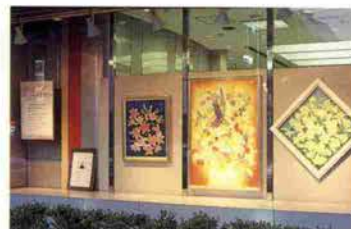
生田新道に面したストリートギャラリー

この“かんしんストリートガ ラリー”も芸術の香りをはの かに漂わせたアートのスポットと して、本年は「アート&クラフ ト'99」と題したシリーズで様々 な作品を紹介してまいります。