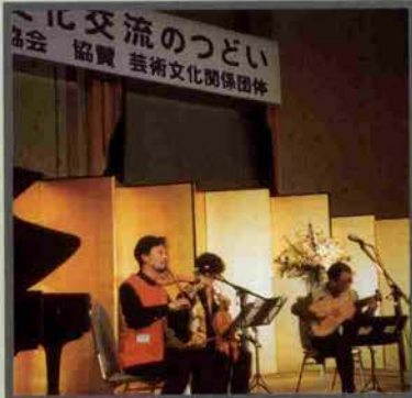
↑平成10年度兵庫県芸術奨励賞贈呈式

12月9日、新神戸オリエンタルホテルで平成10年度兵庫県芸術奨励賞贈呈式がおこなわれ、引き続き「'98 ひとご文化のつどい」と題して受賞者の合奏や員原知事の挨拶をまじえた懇話会が開かれた