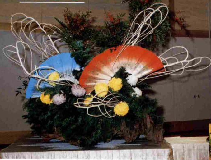
平成10年11月6日、東京・如水会館におきまして、文部大臣より、平成10年度地域文化功労者表彰をしていただきました