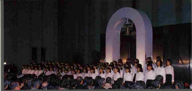
→神戸ルミナリエ、「光の星空」輝く

12月11日から25日の間、第4回神戸ルミナリエが開催され、今年も訪れた人々の心を癒し、魅了した。12月11日の点灯式には、アートディレクターのヴァレリオ・フェスティ氏をはじめ多数の人が出席し、港島小学校のコーラス部による「しあわせ運べるように」の合唱がやさしく響いた