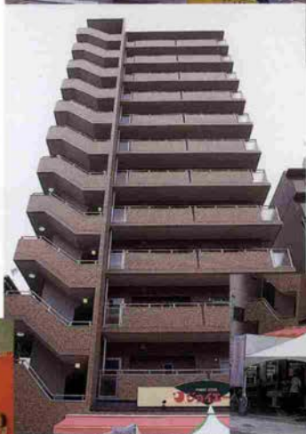
御旅センター市場に立ち上がった「ワコーレグランディール御旅」。 1Fには、ファミリーストア「ジョイエール」がオープン

「昭和三十年五月八日、この地に御旅センター市場を開設し四十有余年に亘り地域繁栄の為に貢献をしてきたが、平成七年一月十七日阪神淡路大震災により市場は全壊の被害を受けた。組合員三十三名は一致協力し、新たに店舗付き住宅「ワコーレグランディール御旅」の建設を計画し、建設省・兵庫県・神戸市の補助を受け、又諸般に及び助力を賜り事業の推進に努めた結果、平成十年六月吉日、建築の竣工に至った。組合員の団結と努力によって事業を成功に導いた記念として、組合員の氏名を記録する」