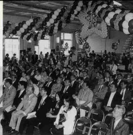
↑「北野工房のまち」が7月11日(土)にオープンした。廃校になった北野小学校をそのまま利用したノスタルジックな空間に、さっそく人々が訪れていた。菓子・靴・和紙など、20の工房が集い、ここだけの限定販売商品も多く、またひとつ神戸の観光名所がふえた