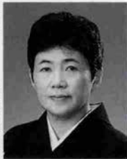
推薦者 奥井電機KK社長

将来は社会福祉の方面に進みたい、日舞の名取にもと大きな夢を膨らませるただいま青春真っ盛りのお嬢さん。美しい黒い瞳が見つめる未来がどう輝くか楽しみに見守りたい。