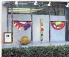
生田新道に面したストリートギャラリー

この“かんしんストリートガ ャラリー”も芸術の香りをほの かに漂わせたアートスポットと して、本年は「神戸のクラフト アート（工芸美術）」と題したシ リーズで様々な作品を紹介して まいります。