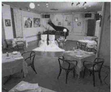
映画のワンシーンのような店内

異人館の街・神戸北野町。その一角にある白い壁と、大理石の階段のシャレた建物が、レストラン・カサブランカ。ため息が出るほど美しかったイングリット・パーマンの名画「カサブランカ」のワンシーンのようなインテリア。シックな色調、落ち