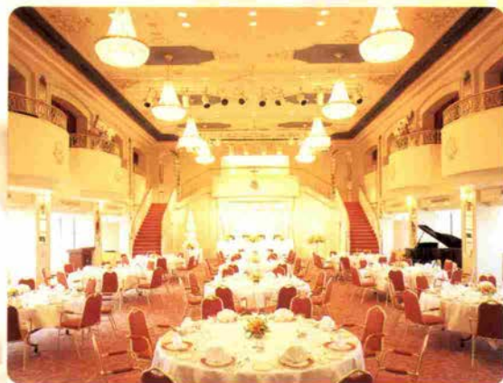
バルセロナホール Barcelona Hall/16F