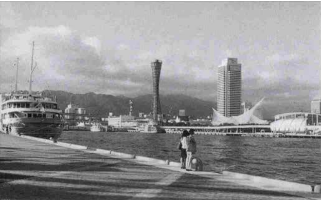
海際に憩うスポットがあるのは大きな魅力

たという利点もあって、私ども神戸阪急では震災50日後に部分開店し、4月には全面オープン。よそも続々と再開され、神戸復興のため神戸市民の元気づけの拠点として一定の役割を果たしてこれたのではないかと思っています。