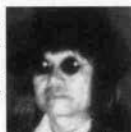
ムッシュかまやつ

出演：ムッシュかまやつ、上田正樹(11日) 神戸で活躍するセミプロのミュージシャンたちによるライブ(12日)