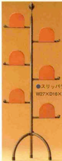
●スリッパラック 25,000円 W27×D16×H75cm