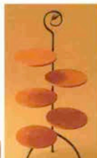
●スリッパラック 30,000円 W38×D25×H90cm