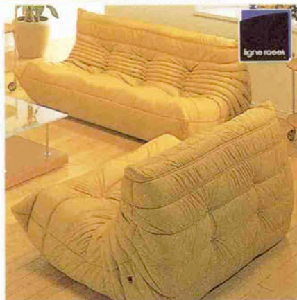
●3人掛ソファ 199,000円 (布張り) W174×D102×H70 (38) cm ●2人掛ソファ 150,000円 W131×D102×H70 (38) cm