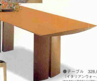
●テーブル 328,000円 (イタリアンウォールナット) W180×D90×H72cm