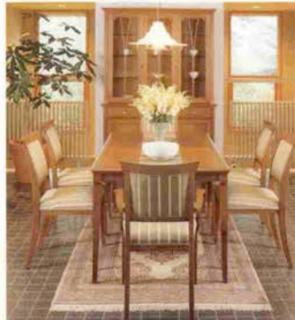
●ダイニングテーブル 123,000円 W165×D85×H62cm ●アームチェア 56,000円 ●サイドチェア 44,000円 ●カップボード 398,000円 W128.5×D45×H190cm