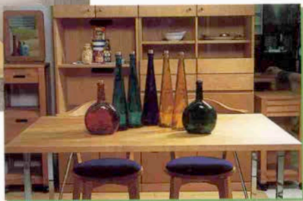
小泉産業 (株) LD-スタイリッシュシリーズ