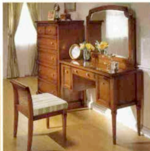
●デスク 92,000円 (ウォールナット) W112×D42×H72cm ●ミラー 37,000円 (ウォールナット) W90.5×H71.5cm (別売) デスクトップガラス 7,000円 ●スツール 30,500円 ●ハイチェスト 128,000円 (ウォールナット) W82×D44.7×H123.3cm