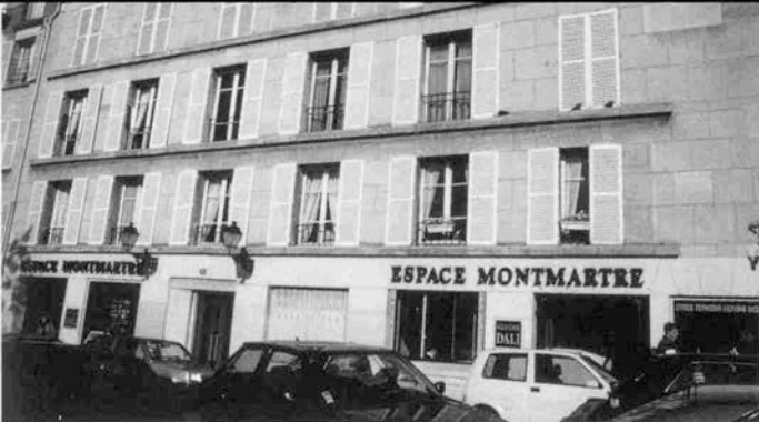
パリ・ダリ美術館の入口は、写真建物1階、右側から2つ目の枠。そこからさらに5つ目の枠が出口

実は、初めての美術館を地図を片手に探しながら訪ね当てるという行為、ちょっとした不安感とワクワクするような期待感があって、悪くないのである。（それは二度目以降では味わえぬ不思議なスリルだ。）従って、時間がありませんれば、当然いつもそれを実践する。今回も、おおよその目処をたてて出発。だいた