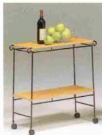
●ラック 24,000円 W75×D32×H76cm