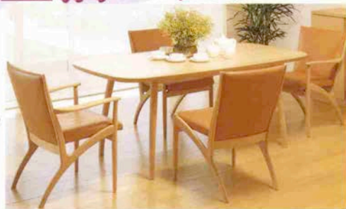
●ダイニングテーブル (ナラ) 153,000円 W180×D90×H68cm ●アームチェア 84,500円 (本革張) ●サイドチェア 74,500円 (本革張)