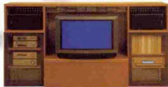
●オーディオボード 426,000円 (イタリアンウォールナット) W100×D44.2×H171cm