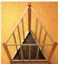
●レインラック 24,000円 W33×D29×H51cm