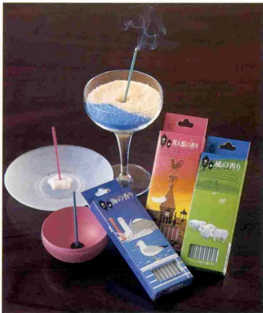
写真左から 「海の香り」、「異人館の香り」、「風の香り」 各8本入り（香立付）800円