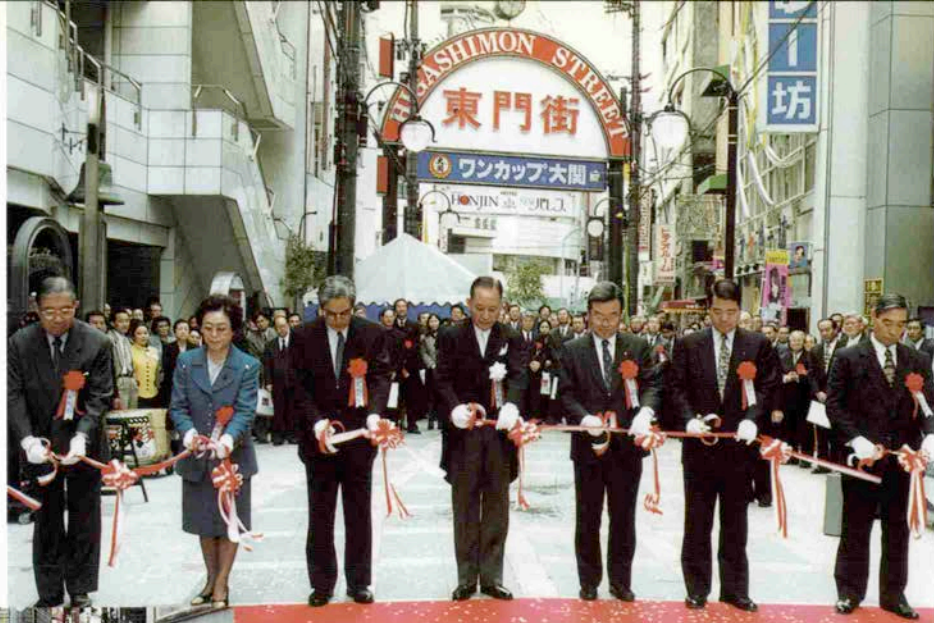
笹山幸俊神戸市長（写真左から3人目）も歩き初め式に訪れた