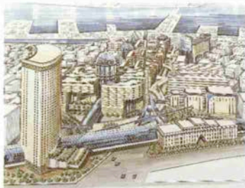
三宮駅北側から南を望んだイメージ図