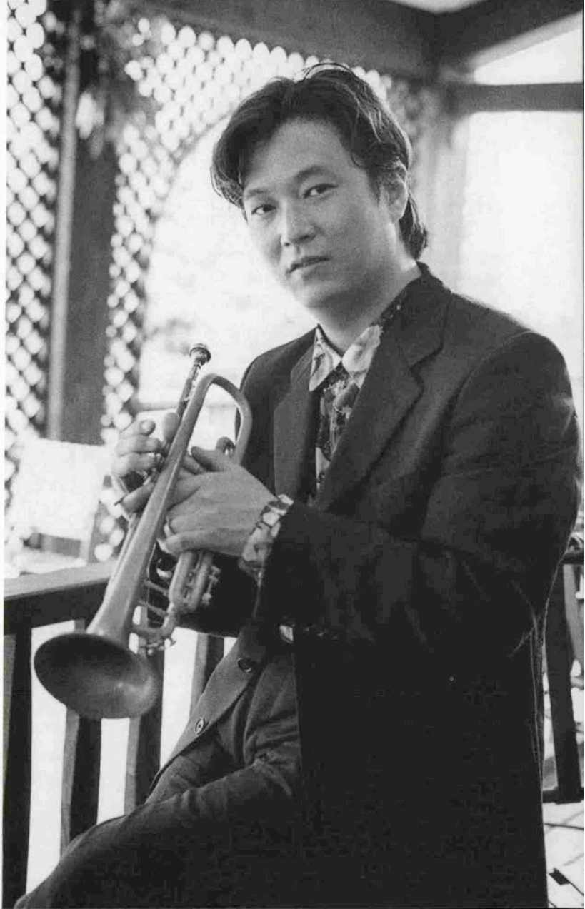
（ハーパーランド・モザイクで