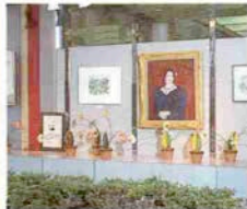
生田新道に面したストリートギャラリー

この“かんしんストリートギャラリー”も芸術の香りをほのかに漂わせたアートスポットとして、本年は「神戸の街角・神戸の女（ひと）」と題したシリーズで様々な作品を紹介してまいります。