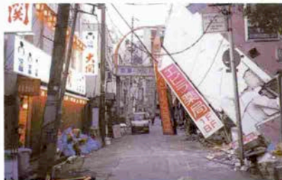
1月17日の悪夢のような光景