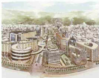
フラワーロードの南から北を望んだイメージ図

震災の年の夏、私は「こうなって欲しいな三宮」という街づくりの“夢”を提案しました。文化・商業施設などを空中回廊で結ぶなど、神戸三宮を特別な魅力のある街にしようというものです。でなければ、大阪に出ていこうとする人を取り戻すことはできません。