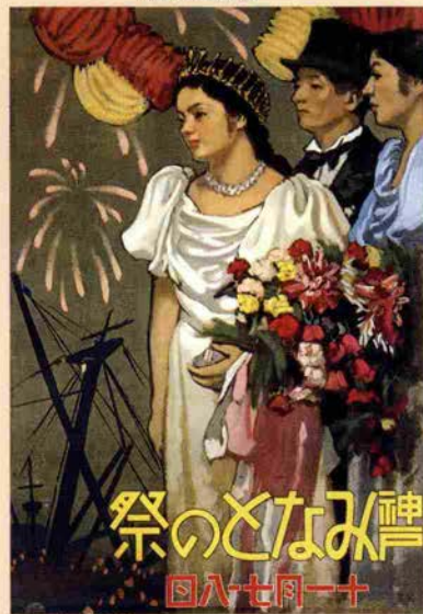
小磯良平「第1回神戸みなとの祭ポスター」1933年

6/12(木)～8/3(日) 収蔵作品展Ⅱ・挿絵原画展「ひとで」 8/8(金)～9/28(日) 企画展「小磯良平の挿絵とデザイン展」 収蔵作品展Ⅲ