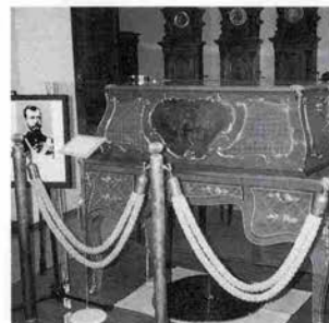
ロシア皇帝ニコライⅡ世が所蔵していたもの

始まる。オルゴールを求めて、世界中を巡ったが結局、オルゴール自体を売っている店というのではなく、コレクターや教会などから譲ってもらったものばかりだという。