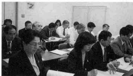
説明会は企業向けに昼から商店向けに夜からと分けて行われた