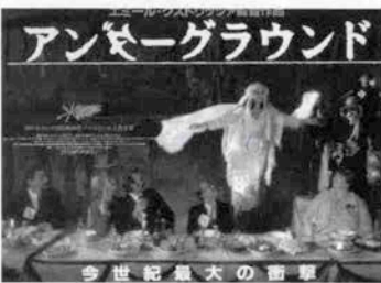
アンダーグラウンド