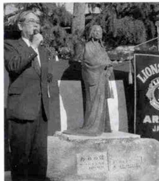
「有馬博物館を」と市長

る「有馬さくら祭り」。これが今年から「ねね祭り」と名前を変えた。秀吉の妻ねねの記念像がこの日お目見えするからである。