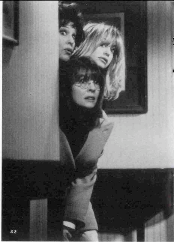
夫にだまされた女3人は仕返しを図るが…