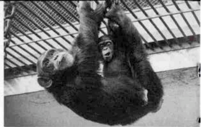
第三夫人ユキちゃん（健在）との間 にはゴビアが誕生

残すことだろう。私はその日の来るのをひそかに待っているのである。（動物園うら話・中外書房／山本鎮郎著）