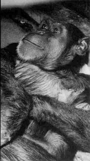
第四夫人秋ちゃん、成ちゃん を出産