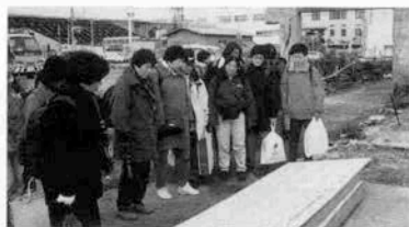
長田区の震災の壁の前で

つある。 第一は、日本には活断層が約二千ヶ所もあると言われている。おり、いつでもどこで誰が被災者になるかわからないこと。