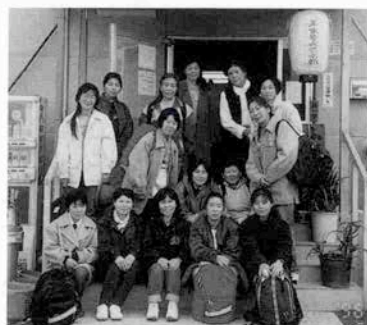
西神第七仮設住宅のふれあいセンターを訪問

震災から三年目にもなるともう被災者のことなどは忘れ去られようとしている。しかし、被災地に関心を持ち続けてほしいと私が願う理由は三つある。第一は、震災は「生活の本当の豊かさ」とは何なのか、を私たちに突きつけ、問いかけていること、である。しかし、被災地を見つめ続けるにはかなりの努力や工夫、想像力が必要だ。エンゼル保育園のように全職員が神戸まで足を運んで何かを学ぼうとする施設や団体はごく少数である。う。「文章はいい」という職員の文集を読むと一人一人が神戸から受けとったメッセージの重みがひしひしと伝わってくる。被災地を歩いた経験は、エンゼル保育園でのこれからの保育のなかにきつというんな形で生かされてくることだろう。