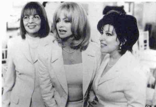
個性派女優がそろい踏み。左から、ダイアン・キートン、ゴールド・デイ・ホーン、ベット・ミドラー

この三人、ゴールド・デイ・ホーンとベット・ミドラーとダイアン・キートンこの三人が演じて見せる熱演。この映画いまさら離婚ストーリーなんかお客は来ない。見どころはこの主演者三人の共演。競演。この女、三人の面力ガミのその面白さ。そこが売りもの。