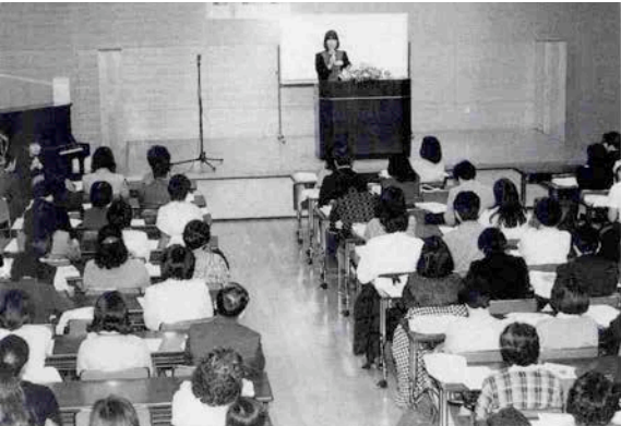
報告会には会場いっぱいの人たちが詰めかけた

三月二十日に東京の練馬区光が丘区民センターに於いて、エンゼル保育園の職員報告会と講演会が開かれたので私もお招きをいただいで参加した。この報告会というのは保育園の職員が昨年神戸の被災地を訪問し、職員が学んだことを園児の保護者や一般の人たちに知ってもらうために開かれたものだった。