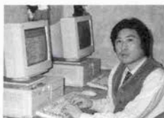
多数的に講演で話術が早口な達者

業後、米国の商社に入社。働きながら、南カリフォルニア大学院でMBA(経営学修士)を取得。近い将来シリコンバレーでインターネット関連の事業を始める体制を整えて一時帰国。東灘で阪神大震災に遭遇した。神戸の惨状を見て、再渡米を断念。米国で学んだインターネットの知識を活かして、元町に神戸で初のインターネットカフェ