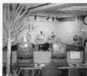
元町にあるカフェ「ネットサーフ神戸」