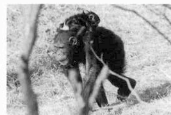
第五夫人リノとの間にはアーリーをもうけた

みかんをやる、摩甲ちゃんは食わずに、彼氏によりかかりながら、彼氏が食べるのを見守っておる。因にチンパンジーは我が国では繁殖の事例がなく、もし第二世が生まれたら、それこそ、わが国の動物園の歴史に輝かしい一頁を残すことだろう。