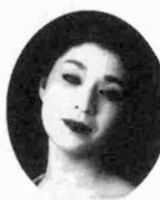
松尾 嘉代 (女優)