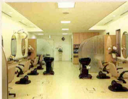
2Fみどり美粧院サロン