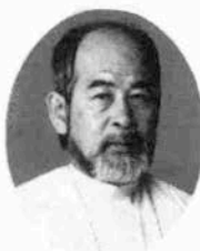
藤井 秀樹 (写真家)