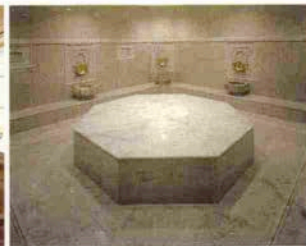
ハмам (ターキッシュバス)