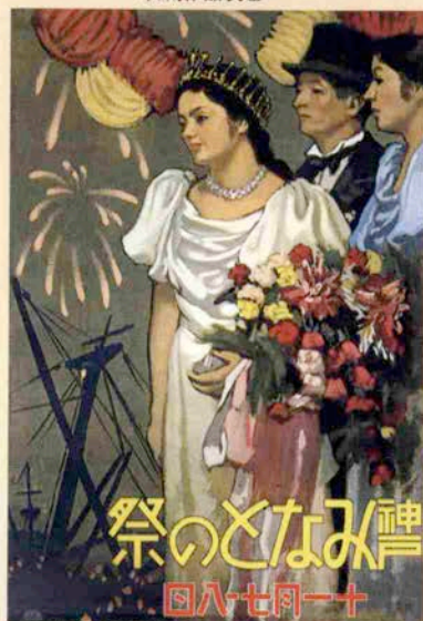
小磯良平「第1回神戸みなとの祭ポスター」1933年

4/11(金)～6/1(日) 収蔵作品展Ⅰ・挿絵原画展「白い魔魚」 (五) [最終回] 6/12(木)～8/3(日) 収蔵作品展Ⅱ・挿絵原画展「ひとで」 8/8(金)～9/28(日) 企画展「小磯良平の挿絵とデザイン展」 収蔵作品展Ⅲ