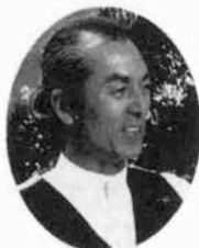
中村 征夫 (写真家)