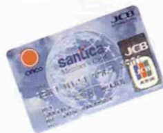
さんちかメンバーズカード Orico Card JCB