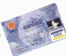
さんちかメンバーズカード Orico Card VISA