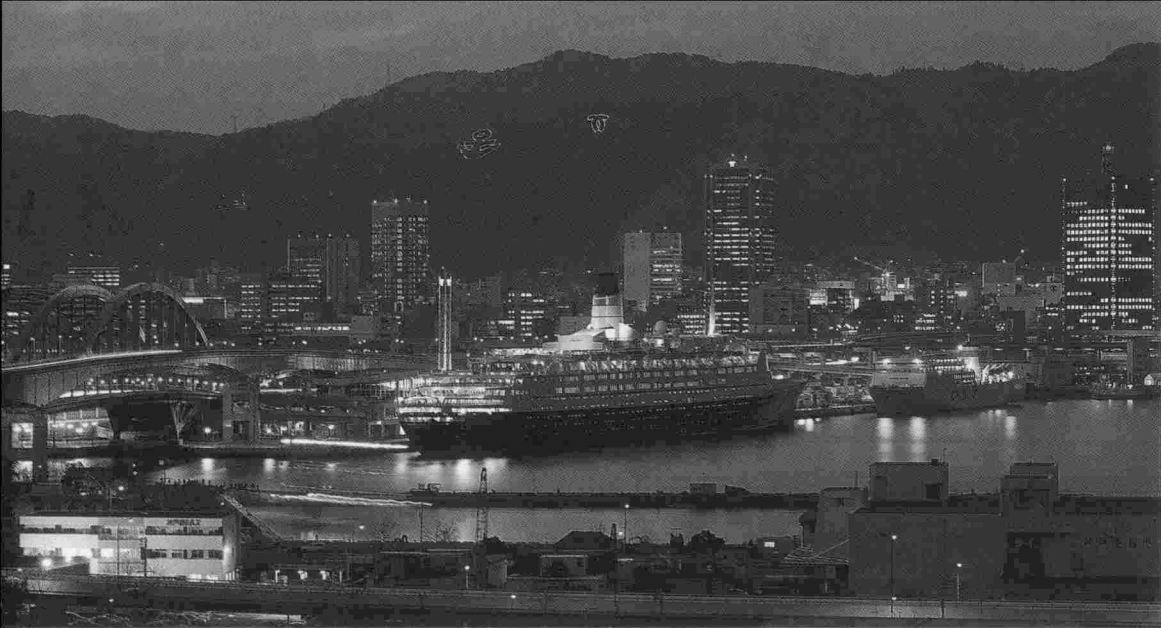
3月3日、神戸港に4年ぶりに寄港したクイーンエリザベスⅡ

えられるが、平日であつたことを考慮しても寂しい光景であつた。このクイーンエリザベスⅡが入港して、