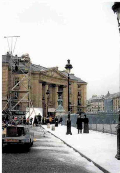
フランス映画?の撮影風景。 ここだけ切り取ると一世紀昔 に旅立つ