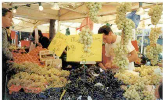
ブドウの国、フランス。マスカットが果物屋さん