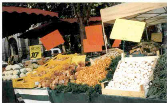
マルシヤに並ぶキノコ類。おいしそう