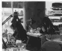
自分の爪で真剣に勉強する

「クレオパトラみたいな長いきれいな爪に憧れるけれど、形もよくないしすぐ折れちゃうし・・・」という女性も今は爪のおしゃれが楽しめる。ここ数年話題の「ネイルサロン」。北野にも昨年5月にネイルサロンとカレッジが一緒にオープン。プロのネイリストの技術を学ぶ「ネイルズユニークカレッジ」には20代