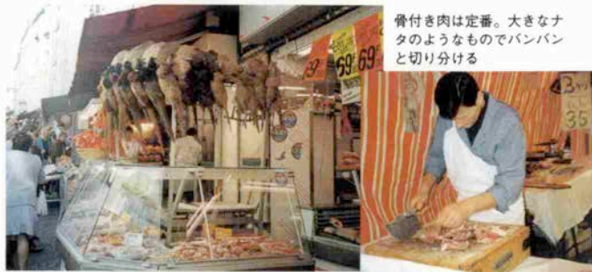
ギョツとする人もいるかも。キジが並ぶ肉屋の店先