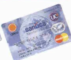
さんちかメンバーズカード Orico Card UC/マスター

世界で使えるJCB、VISA、UC、マスターカードの中からお選びいただけます。 さんちかでのショッピングの割引や、さんちかギフト券でのキャッシュバック、特別イベントへのご招待など会員だけの特典がいっぱいです。