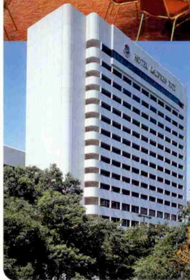
バルセロナホール Barcelona Hall/16F

オペラの劇場を訪れたかのような壁面のバルコニー、堂々と広がるゆとりの空間と高い天井。ヨーロッパの宮殿を思わせる「バルセロナホール」は、多くのお客様をお招きできるスケールの大きな宴会場です。舞台そでからつながる階段を上れば、そこはチャペル「モンジュイック」誓いのセレモニーを終えたら、そのまま皆様の待つ華やかな宴会場へ……そんな素敵な演出もおすすです。