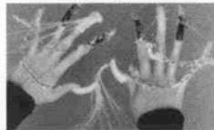
世界大会ではこんな立体的な作品も

■ネイルズユニーク北野本店 神戸市中央区中央区山本通1-7-2 TEL (078) 221-1610 10:30~18:30 (定休前) デラックスネイルケア ¥4,500 オイルマニキュアトリートメント ¥6,000 定休日: 毎週火曜日 ■ネイルズユニークカレッジ 住所同じ。TEL (078) 222-0151 (代)