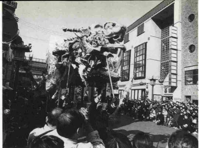
南京町の春節祭が2月23日から3日間にぎやかに行われた。名物電誦りが連日練り歩き、神戸復興へ市民の気持ちをかき立てた