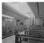
神戸ポートピアホテル