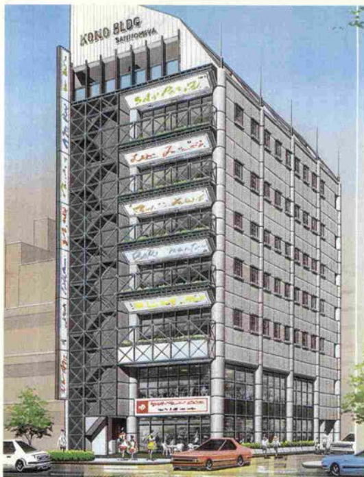
三宮高野ビル(仮称)の完成予想図

昨年の夏、わたしは「こうなってほしいな、神戸三宮」というまちづくりの夢を提案しました。その中で「神戸三宮は、特別でなければなりません。大阪に出て行こうとしている人たちを取り戻すには、それだけのものを作らなければなりません」と述べました。いま、その一つとして、神戸国際会館南側に位置する「三宮高野ビル」(仮称)を計画、コンストラクション・コンダクターとして取り組んでいます。