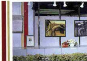
生田新道に面したストリートギャラリー

長年「女のいる風景」 と題して女性像を中心に 仕事をつづけている。そ れぞれのモデルを写しな がら自分の絵にするわけ だが、どうしてもそのモ デルのもつ雰囲気が画面 の中に現れてくる。それ がよい効果を造るときと、 そうでないときがある。