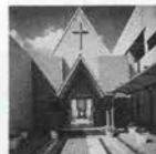
神戸ハーバーランド ニューオータニ