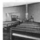
新神戸オリエンタルホテル