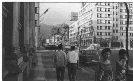
▲1961年の京町筋。左の建物は東京銀行神戸支店。並木はヤナギの木だった