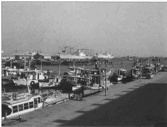
▲1961年のメリケン波止場。ハシケだまりの船は沖の船の荷役で活躍し、同時に水上の住居でもあった

空間の空白感は、まちの原点を見せてくれたのかもしれない。市電があれば、バスより便利だったかも知れない。旧居留地には、ケヤキよりヤナギの方が柔らかだ。35年の空白、まちは挑戦を待っている。