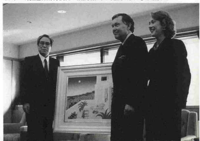
明るい神戸の絵を描いている米国人画家トーマス・マックナイト夫妻が、2月9日、ポスターの売上金300万円と新しい作品を神戸市に「復興のために」と寄贈した