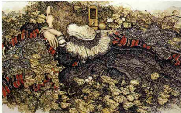
黒と赤の縞のある布 〈女のいる風景〉

この“かんしんストリートガ ラリー”も芸術の香りをほの かに漂わせたアートのスポットと して、本年は「世界の女性」と 題したシリーズで様々な作品を 紹介してまいります。