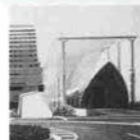
神戸メリケンパーク オリエンタルホテル