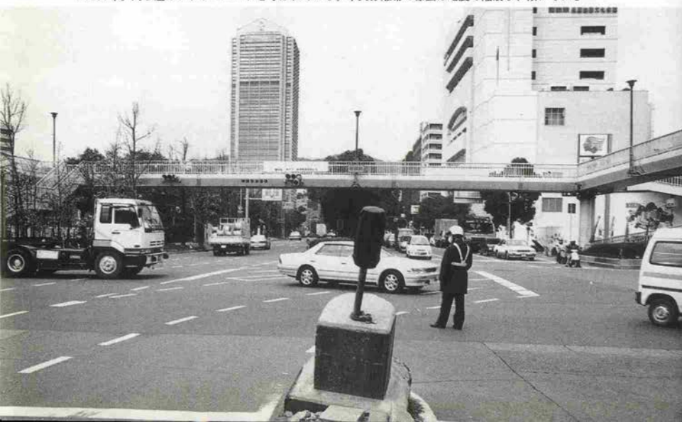
▼1996年。同じ道はフラワーロードと呼ばれている。中央分離帯の標識は地震で陥没し、傾いている