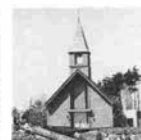
神戸市立 フルーツ・フラワーパーク