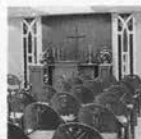
ホテルパールシティ神戸