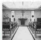
ホテルゴーフリッブ