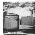
六甲オリエンタルホテル