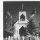
グリーンヒルホテル第2