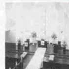
ホテルオークラ神戸