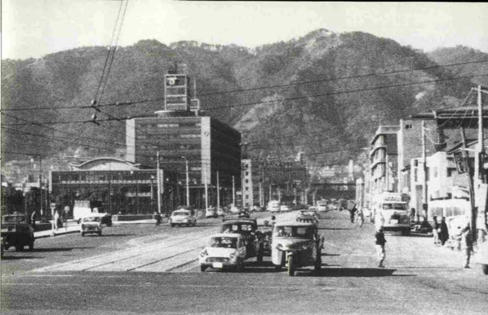
▲1961年の市道税関線。市電石川線の終点にオート三輪が並んでいる。カマボコ型の屋根は市議会庁舎