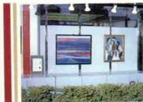
生田新道に面したストリートギャラリー

この“かんしんストリートギャラリー”も芸術の香りをほのかに漂わせたアトスポットとして、本年は「世界の女性」と題したシリーズで様々な作品を紹介してまいります。