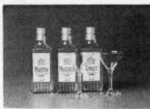
バーで圧倒的人気のカクテル3種類

★メルシャン株式会社より、新発 売のカクテルクラシックと、オリジ ナルカクテルグラスセットを!