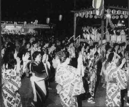
▲老いも若きも踊らにヤンソンソノ