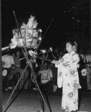
▲夏の夜にかがり火が灯される