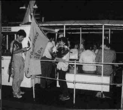
▲法要の後、お地藏さんと共に船に乗り込む ▼山向きと海向きの2体のメリケン地藏さん