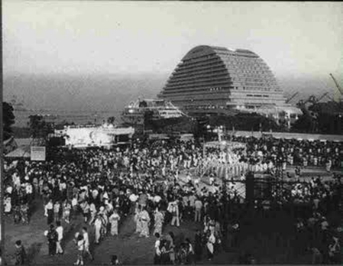
▲会場となったメリケンパークには人の波