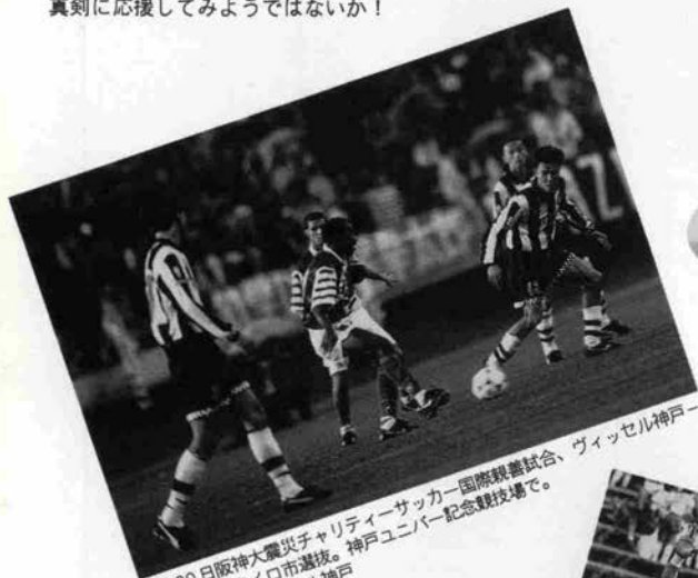
4月30日阪神大震災チャリティサッカー国際親善試合、ヴィッセル神戸ーリオデジャネイロ市選抜。神戸ユニバー記念競技場で。