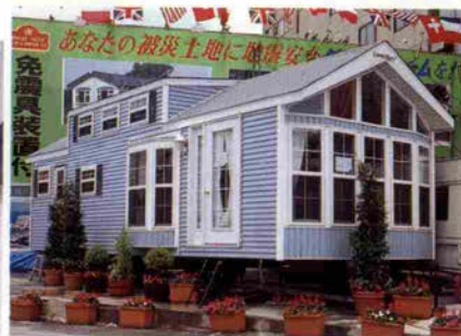
アメリカ製カンタベリーL20 ロフト付き16坪フル装備