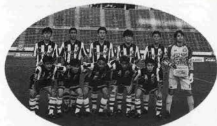
ヴィッセル神戸のイレブン

4月30日阪神大震災チャリティサッカー国際親善試合、ヴィッセル神戸ーリオデジャネイロ市選抜が神戸ユニバー記念競技場で行なわれた。神戸のサッカーファンが待ちに待ったヴィッセル神戸のデビュー戦である。震災後、幾多の苦難を乗り越えてようやくスタート地点に到達した。5月7日には第4回ジャパンフットボールリーグが始まった。スタンドではそれぞれのユニフォームに身を包んだ3600人のサッカー少年・少女も応援に加わった。まずはJリーグ昇格を目指して、温かい目で見守りながらも、神戸を代表するチームとして、真剣に応援してみようではないか！