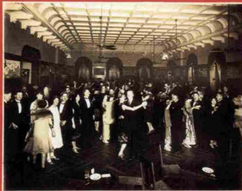
神戸市立中央公会堂 1994年10月31日撮影

1994年秋、ファッションとアートへの新しい提案が織り成す都市伝説がはじまります。