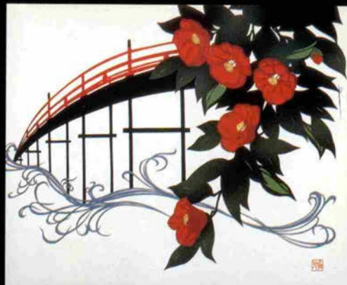
「花の乱」第2話 火の橋水の橋