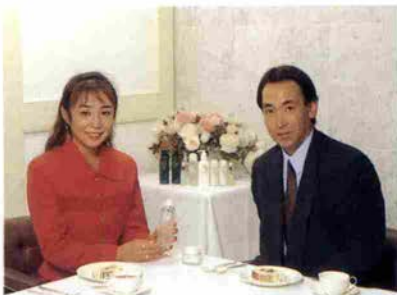
レストラン北野クラブにて

ほとんど、無理やりやらされることになりました(笑)。いやいや始めたんですけど、まあやりだしたら結構楽しくて、3か月目くらいに初めて出た試合で、すぐ優勝してしまっただけです。順調に行きすぎた分、こわくなりました。