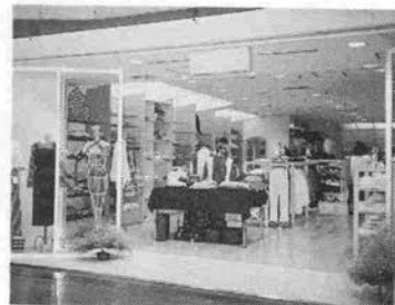
ナチュラル感覚あふれる店内