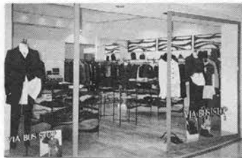
店内には新時代デザイナーによる商品が一杯

■神戸市中央区三宮町1-8-1-231 さんプラザ2階 電話(078)392-1121 11:00~22:00