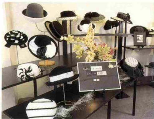
モデル／ブントール素材、キャベリーヌ型の帽子をかぶる渡邊百合社長 (カシニョールの絵の前で)