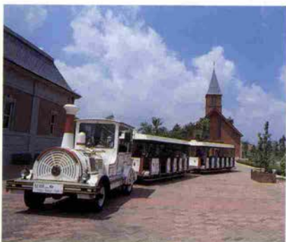
園内を周回できるチューチュートレイン

開園時間 午前9時～午後5時（年中無休） 入場料金 大人500円 小人250円 駐車場 普通車500円 マイクロバス1000円 バス2000円 二輪車200円（1500台収容）