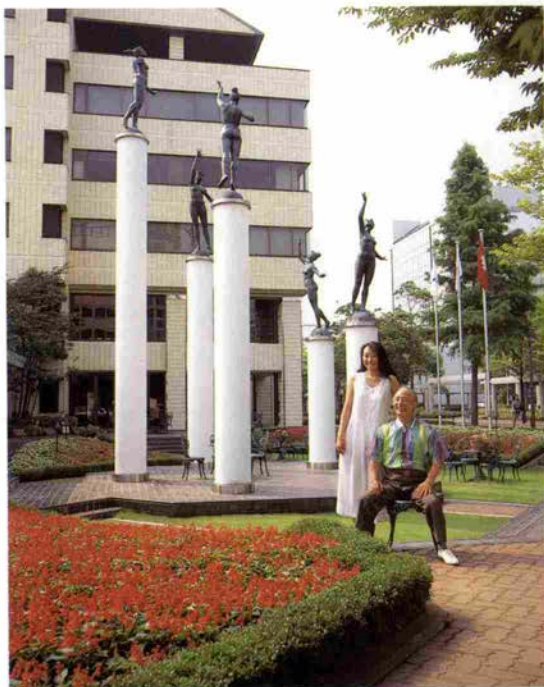
「心打つ芸術は魂の歌声」ビクトリアガーデンにて