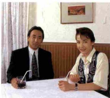
タカラヅカカラベルにて

男役さんだからこういう表現をさ せて貰いますが、男っぽいガチッ としたタイプですよ。それにな んといってもあの流し目と去り際 でふり返るときの表情が印象的 ですね。