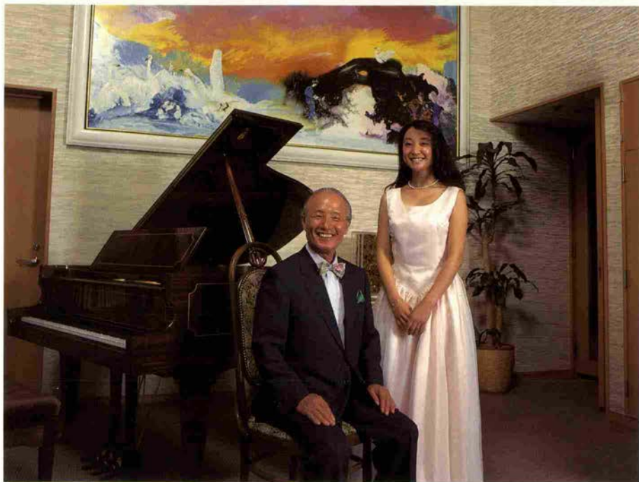
「僕のための演奏をしてもらえるなんて、最高の贅沢」と川上会長。