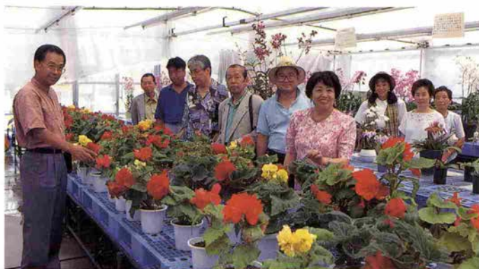
パーク内フラワーショップにてお買い物

〒651-15 神戸市北区大沢町字西谷2150 TEL 078 (954) 1000 FAX 078 (954) 1023