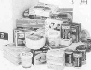
▲食品やサイズや用途によって分けて保存できる便利なバスケットが付いています。