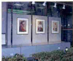
生田新道に面したストリートギャラリー

“ときめきバンクかんしん”は「共感・対話・信頼」を企業理念として、地域の文化・芸術の育成に努めております。