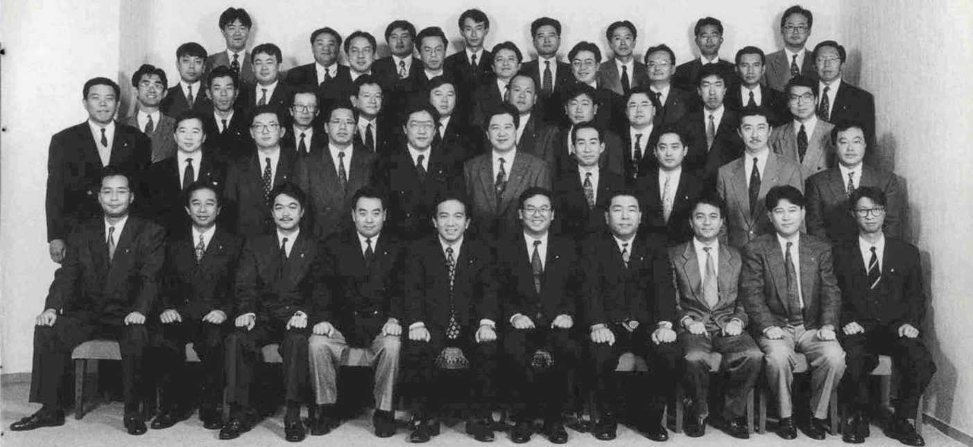
ある集い ■ (社)神戸青年会議所 理事会構成メンバー