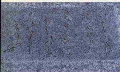
(上) あじさいシステムを利用して建てられた「ブリック・ブロック」