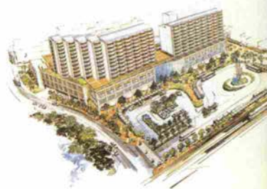
垂水駅西地区の完成予想図