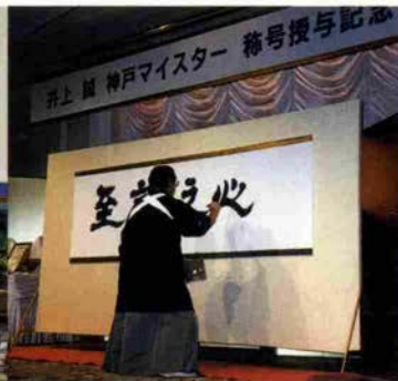
称号授与記念祝賀会にて書道師範の腕前を披露。