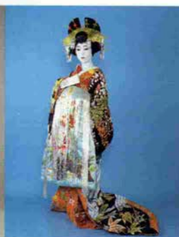
神戸ブライダル技術発表会に於て 伝承着付の中から花魁(おいらん) を。モデルは高校生(男性)。