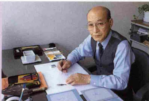
このデザインルームから素晴らしい作品が生まれる。