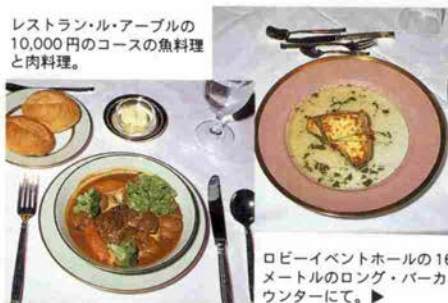
ロビーイベントホールの16 メートルのロング・バーカ ウンターにて。▶