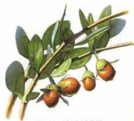
▲ホホバ (JOJOBA) 古くはアメリカインディアンが傷の治療や食物として重宝していたといわれている。

アシアヌーヴォーヘア&ボディケアシリーズ アルフォンス・ミュシャの著名な作品をも ってデザインされたお洒落なパッケージ。 地球にやさしい製品です。