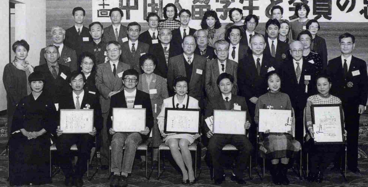
ある集い ■ 兵庫県中国人留学生支援の会