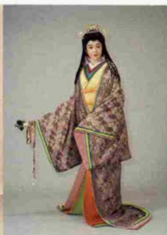
着物(平成重帷)、髪(雅垂髪)ともに 創作オリジナルとして発表。モデル はやしきたかじんの奥様。