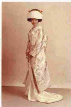
1968年の作品。 全日本美容花嫁着付 コンクール銀賞。