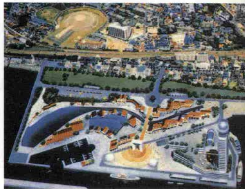
「マリンピア神戸」の完成予想図