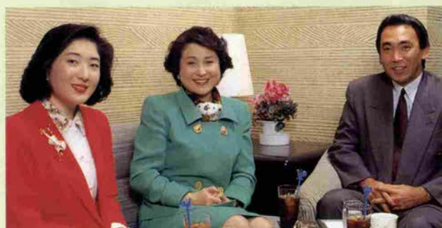
ポートピアホテル、ベルクールにて

て、基本的には「地肌、毛根、血管」の3つの要素に着目し、まず、地肌のふけや皮脂を取り除いてきれいにし、また毛穴につまった老廃物をとり、末梢毛細血管の血行を良くしてやることで、髪の毛がはえやすい状況を作ります。