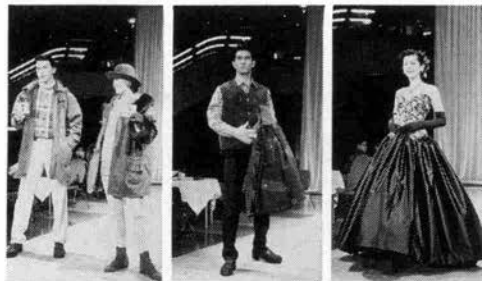
イタリアらしい華やかなファッションが次々と登場

1月18日から21日まで、六甲アイランドの神戸ファッションマート1Fアトリウムプラザにおいて第2回フィレンツェフェアが開催された。素材と仕立ての良さに定評があるフィレンツェのファッションを、ショーツやサンダルで紹介したもので、皮やフェイクファー、ニットなど、コートを中心に、カジュアルからフォーマルまで、数多くの品が展示された。