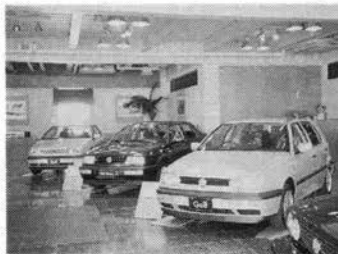
アウディ、ゴルフが並ぶ素敵なショールーム

おしゃれな店がたち並び、注目度ナンバー1の山手幹線沿いにあるトヨタ系の輸入車販売店DUO御影が、この2月でオープン1周年を迎える。フォルクスワーゲン