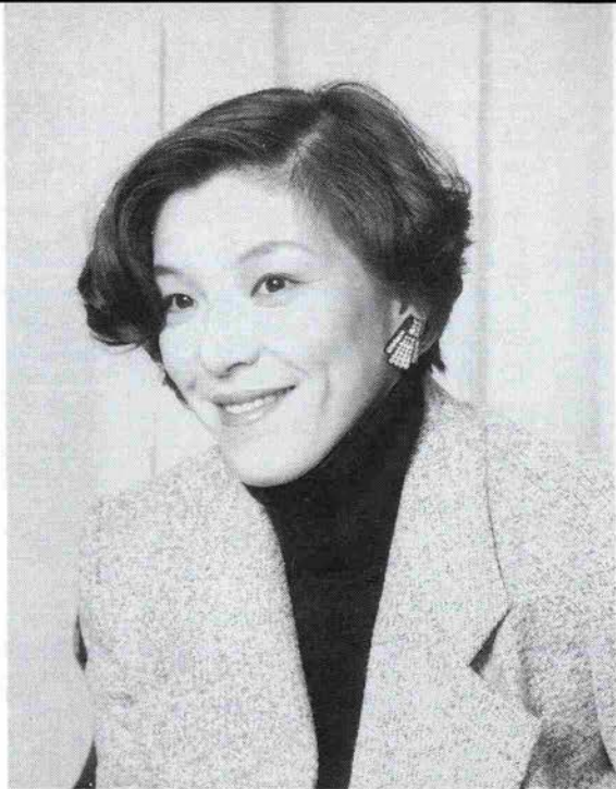
大浦みずき—おおうら みずき 宝塚歌劇団出身。'74年初舞台。'88年花組トップスターに。'91年退団。'92年宝塚のN.Y.公演ゲスト出演。'93年ファーストアルバム「MY LOVE」リリース。'94年2月大阪、4月東京でミュージカル「ザ・シンギング」に主演。エッセイ集も2冊出版。

やらなければいけないジャンルが多いので、集中的にジャズだけをやり続けてはいなかったです。タカラヅカでジャズが舞台に載るのは、ジャズのお好きな先生がスタンダードっぽいものを並べてショーを作られるケースですから、本当にオーソドックスなスタイルが多いですね。