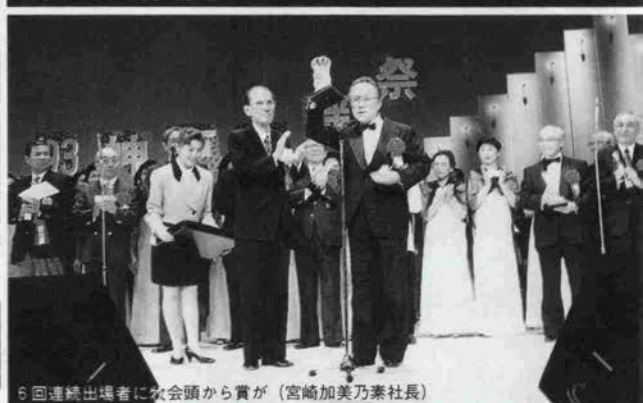
6回連続出場者に次会頭から賞が（宮崎加美乃素社長）