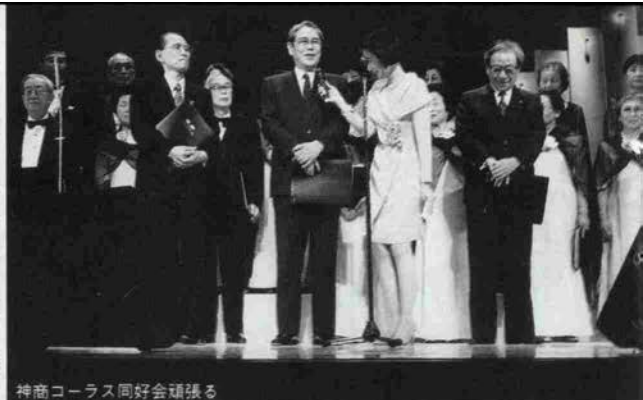
神商コーラス同好会頑張る