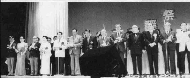
フィナーレは全員で雪やコンゴラを。