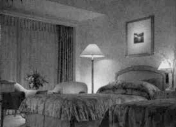
▲ゴージャスなツインルームの窓から横浜港が…