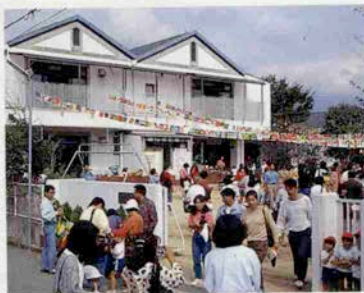
地区住民の理解と関心が美観を守る

隔は1メートル以上なければならぬという条件もありますが、ただこの条件を満たすことで、ゆとりある空間を持った落ち着いた街並が保たれているのも事実です。他にもいくつかの項目があります。これらは全て街全体の美観や安全を守るためのものなんです。