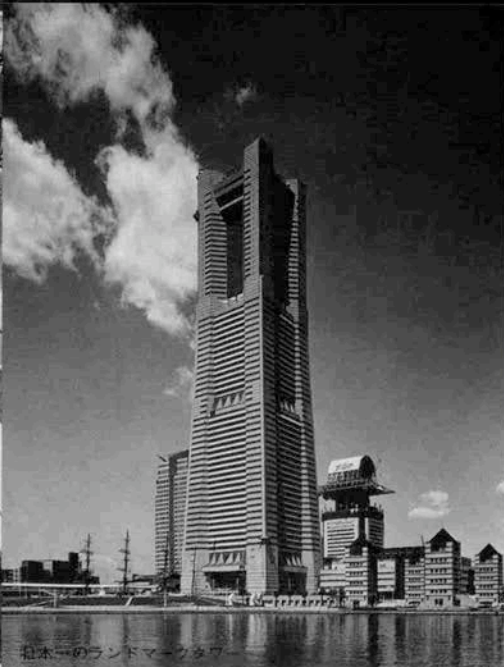
ランドマークタワー