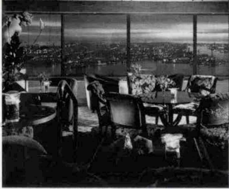
▲スカイラウンジ「シリウス」夜もいろいろ朝食もいろいろ