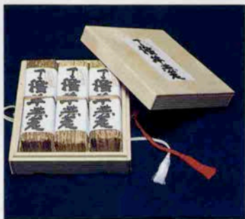
丁稚羊羹木箱3本入り 3200円