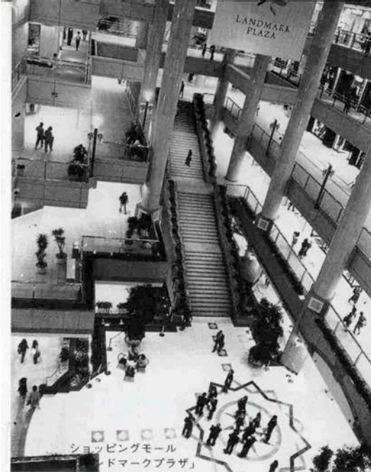
ショッピングモール 「ランドマークプラザ」