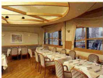
神戸港や六甲山の眺めが最高です。