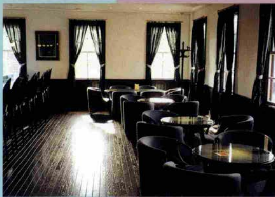
新在家ROKKO 23 酒バー “酒泉”