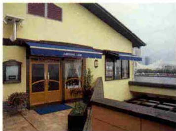
家庭的な雰囲気のお店です。