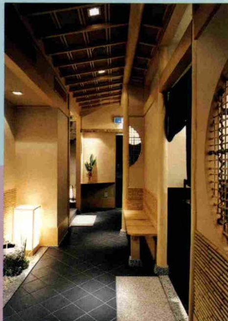
J R 神戸駅前 日本料亭 “しるー”