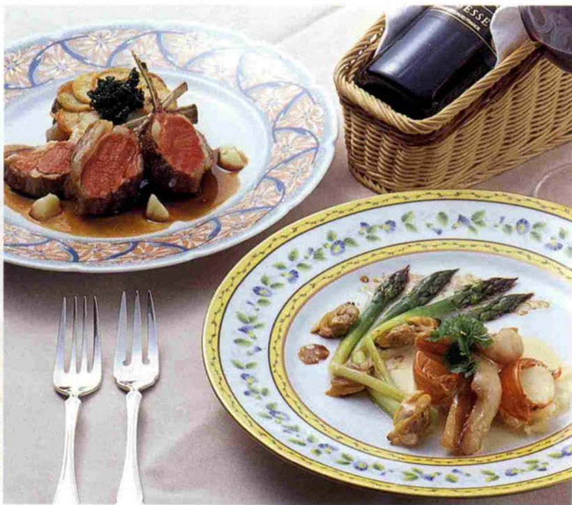
仔羊のロースト 海の幸のバルサミコソース