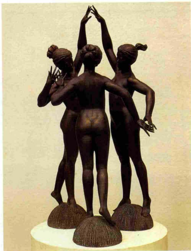
LE GRAZIE (三美神)