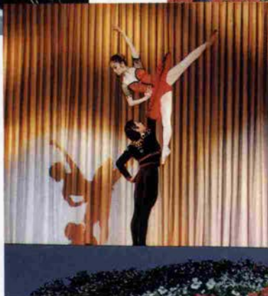
小嶋・大島の鮮やかなドン・キホーテ