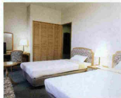
ツインルーム。1名宿泊 9858円から