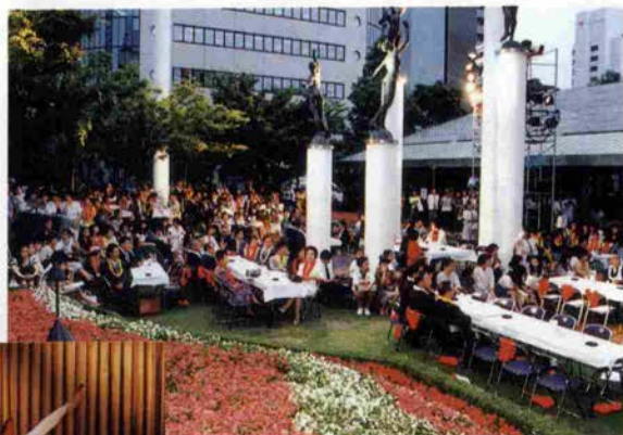
ヴィクトリアガーデンの女神たちに見守られて バレエを楽しむ