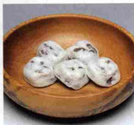
1つ36g、50円 お買い求めは、 同店で直売の他、神戸大丸で

吉村豊助が店を構え、湯治客を相手に蒸しまんじゅうを売り出した。これが豊助饅頭の始まりである。