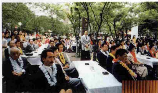
木影で涼しく舞台に熱中