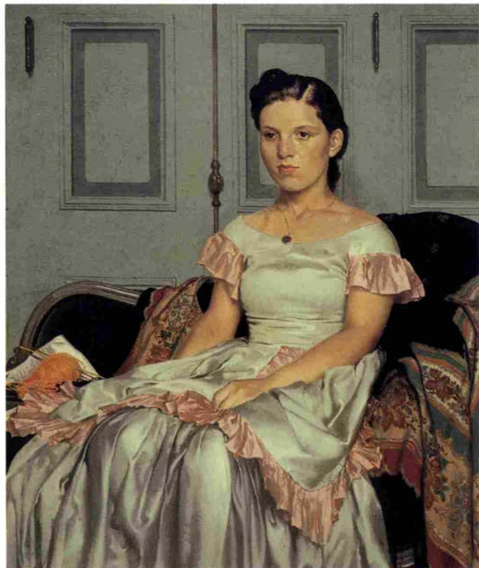
●小磯良平肖像画シリーズ 「肖像」(1940)

神戸っ子 昭和40年1月20日 第三種郵便物認可 1993年8月1日印刷 通巻388号 1993年8月1日発行 毎月1回1日発行