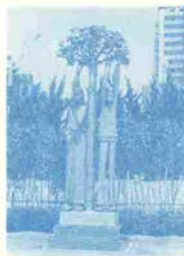
第6回展の神戸市長賞(大賞)作品

会期 平成5年9月1日(水)~10月11日(月) 午前10時~午後5時(無料) 会場 神戸ハーバーランド特設会場 主催 神戸市 財団神戸市民文化振興財団 読売新聞社 読売テレビ