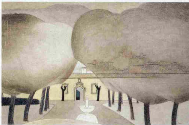
樹精 I 〈イタリア・アッシジ〉

樹塊の造型の中にこれらの風物を包み込んで、「樹精」シリーズと題し、今しきりに制作を続けている。