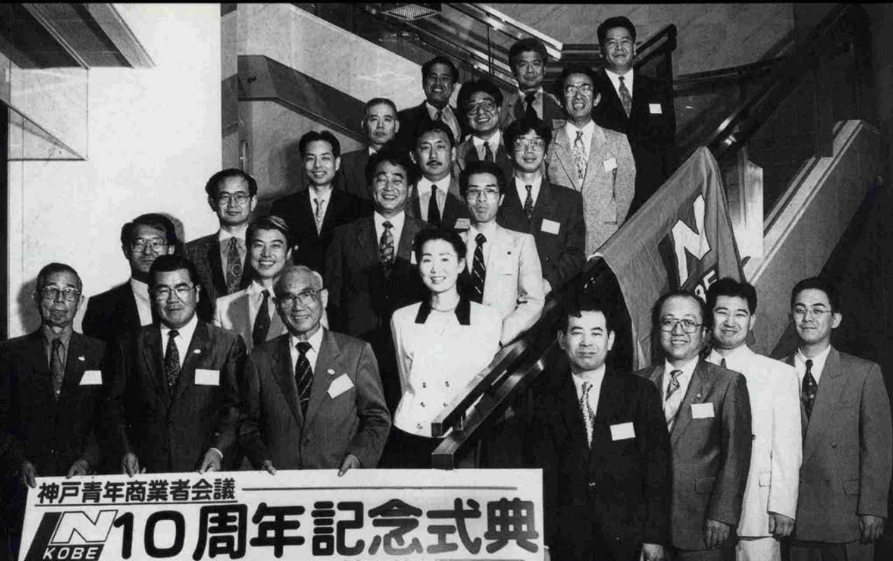
ある集い ■ 神戸青年商業者会議