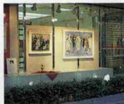
生田新道に面したストリートギャラリー

“ときめきバンクかんしん”は「共感・対話・信頼」を企業理念として、地域の文化・芸術の育成に努めております。この“かんしんストリートギャラリー”も芸術の香りをほのかに漂わせたアートスポットとして、本年は、世界の街角シリーズと題し、世界の街角の風景を描いた作品を紹介してゆきます。