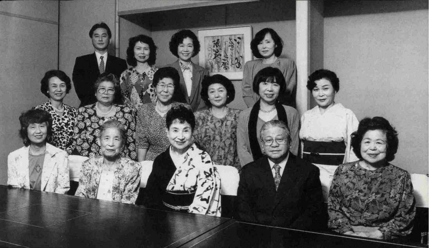
ある集い ■ 望月書道芸術院