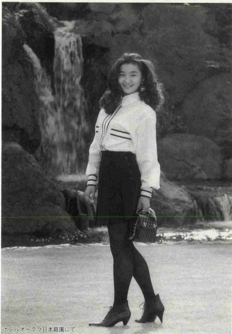
ホテルオークラ日本庭園にて