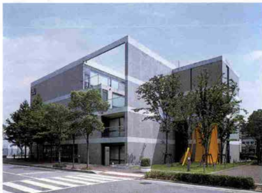
▲P & Pスタジオ

昭和6年の創業以来、戦中の一時期を別にして、チョコレートをつくり続けて来ました。戦後の荒廃期にも、当時としては高価なチョコレートが売れたのは、チョコレートが持つ“優しさとロマン”が人の心をとらえたからでしょう。昨今、バレンタイン・デーが国民的イベントとなっていますが、私どもでは昭和11年から取り組んでいます。恋人やファミリー、あるいは、友人同士が、お互いに“愛を育む日”として末永く愛されるお祭りになって欲しいですね。これからの時代は、生産性一本槍ではなく、“おしゃれ、ファミリー、しあわせ”と言ったことがキーワードになると思います。私どもでは、“ロマンのあるスイート”を提唱していますが、今後も感動ある商品づくりによって優しさとロマンを演出して行きたいですね。