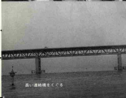
長い連絡橋をくぐる