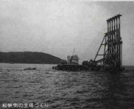
松帆側の主塔づくり