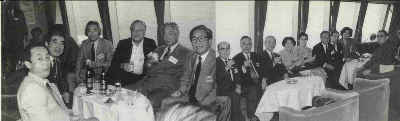
貝原知事を囲んで船上で和気あいあいと