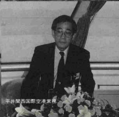
平井関西国際空港常務