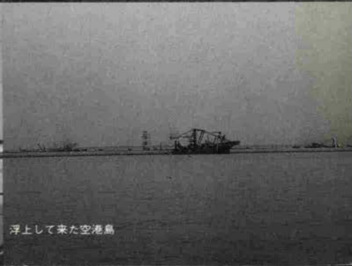
浮上して来た空港島