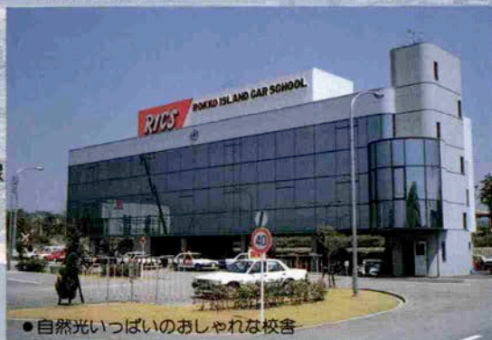
●自然光いっぱいのおしゃれな校舎

ポートアイランド線 三宮山手線 青谷・水道筋線 六甲線 住吉・本山線 芦屋線 御影・渦森線 夙川・芦屋シーサイド線