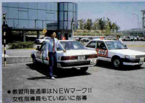
●教習用普通車はNEWマークII 女性指導員もていねいに指導

未来都市六甲アイランド。そこは新しい発見がいっぱい。広々としてゆったりとした公園で散歩したり、輸入雑貨店でショッピングをしたり、自由を味わえる空間です。そんなスペースでカーライセンスを取るのもグッドアイデア。美しい島を優雅に走ってみたい。