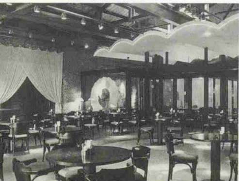
▼モダンに改装された店内(ビアホール)