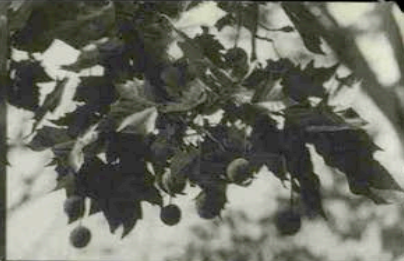
住吉六甲線