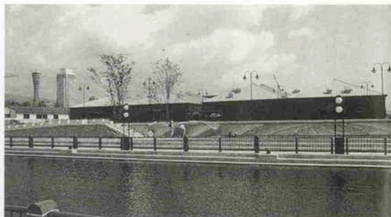
▲美しく整備された海岸とレンガ倉庫