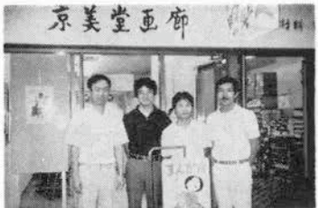
漫画ぐるーぷ新撰組のメンバー

同グループは'88年虫プロ 発行雑誌「COM」がアマ チュアのグループを募集し たことからスタート。その 後、月刊誌「雪」に4コマ 漫画、社会風刺のひとコマ 漫画などを連載。一昨年の 夏は連載100回を記念してこ れらの作品をまとめた「漫 画ぐるーぷ新撰組」を発行。 今回の漫画展は「平成の 女」がテーマ。競馬を見な がらビールを飲む女性、オ ジシギャルなど平成の女性 の特徴を描き、好評を得た。