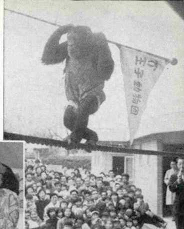
“動物を計る会”には人を集めるため、当初、チンパンジーショウをしたり、ウサギ、ヤギ、子ヤギと遊べる子供動物園を作ったりした。