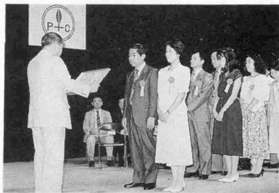
知事からの感謝状を受ける里親たち

さまざまな理由はあげられようが、これから里親制度を伸ばしていくのはそう簡単なことではないだろう。里親会はこれからどうなっていくのか。次の40周年へ向かって厳しい問いかけが今なされている。