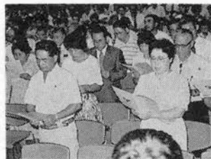
「里親信条」を読む参加者たち