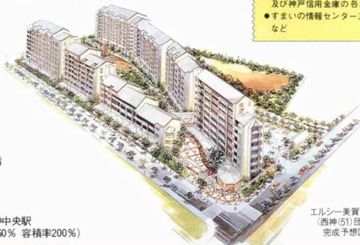
エルシー美賀多台 〈西神(51)団地〉 完成予想図