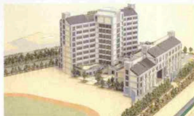
▲平成4年竣工予定の 神戸女子短期大学新学舎 (三宮ポートアイランド)