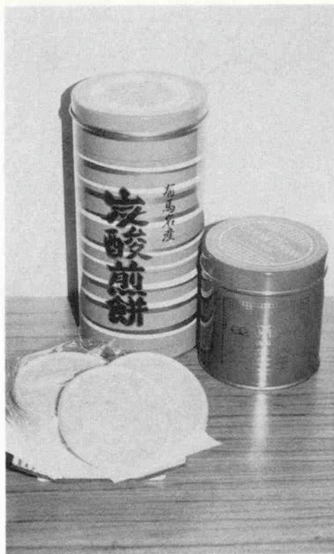
永遠の滋味…有馬炭酸煎餅

ところで、この煎餅には独得の模様がある。円の周囲に登録商標名をローマ字表記したアレである。実はこの様