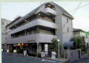
水木北野シルクハイツ II 神戸市中央区山本通2-2-13