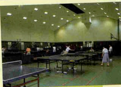
▲ 屋内運動場 休憩室 ▼

〒651-11 神戸市北区しあわせの村内 ☎(078) 743-8181 FAX(078) 743-8180 宿泊・会議室予約専用(078) 743-8000