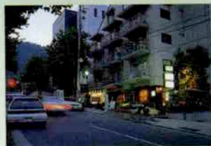
水木北野シルクハイツ I 神戸市中央区山本通1-7-21

水木北野シルクハイツ1B1 TEL 078-222-2423 5:00PM~4:00AM 年中無休