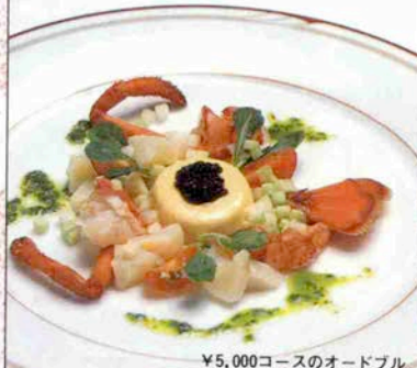
¥5,000コースのオードブル

新鮮な食材をを贅沢に使った味が楽しめる本格派のお店です。写真はシェフおすすめ「オマール海老とホタテ貝のサラダと生うのにパバロア添え、香草ソース」のランチオードブル。