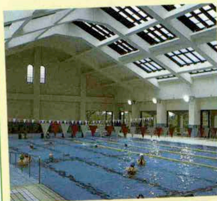
温水プール▲ ジャングル温泉(バーデハウス)▼