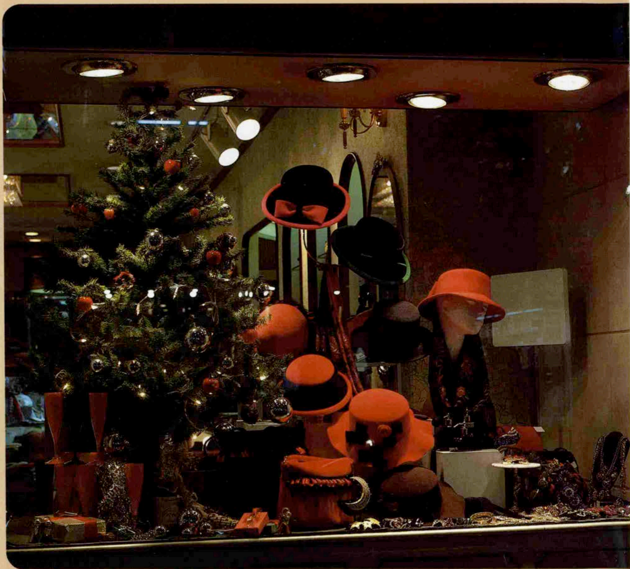
マシンのウインドーを飾るエレガントな帽子たち