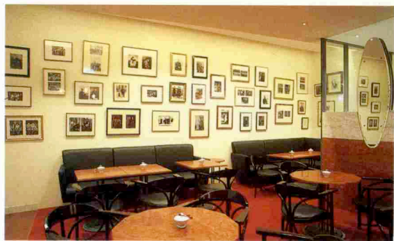
▲ 2F Tee Salonにある禁煙室