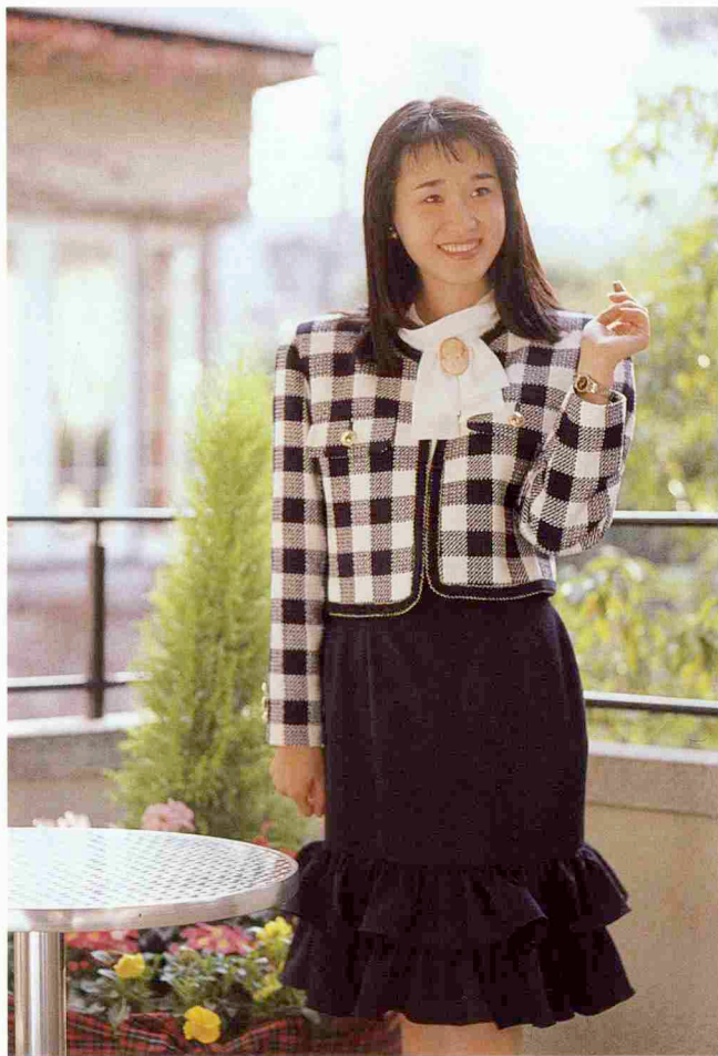
ブルーベル・スリーピース (¥69,000)