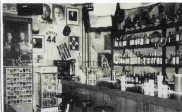
▲スポーツ人間大集合 /

入り口へ降りて行く階段の手すりはバット。店内はプロ野球の外人選手のユニホームや大リーグ選手のカードなどスポーツ関係の資料や用具がどっさり。スポ