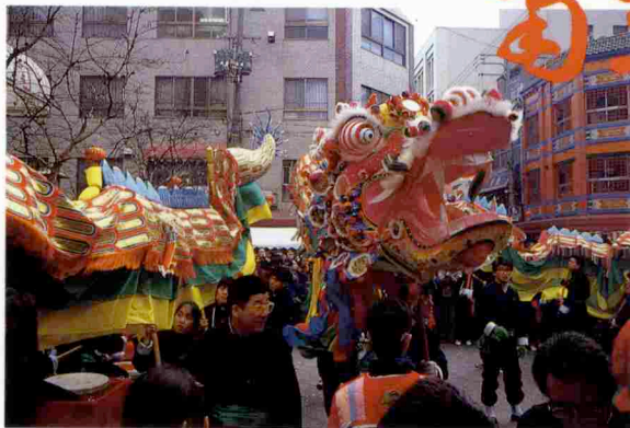
▲龍をかつぐ「舞龍隊」の参加申し込みは、 南京町商店街振興組合 ☎(078) 332-2896まで