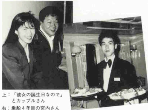
上：「彼女の誕生日なので」とカップルさん