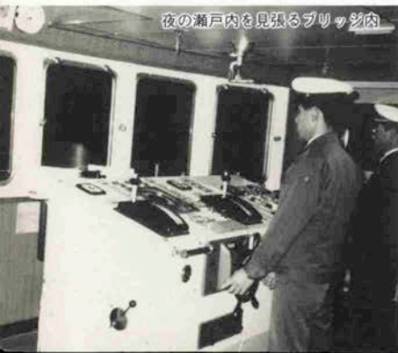
夜の瀬戸内を見張るブリッジ内