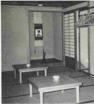
ロビー脇の和室一茶室兼コートクロック