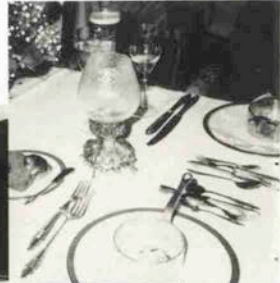
右：船上レストランのテーブル 下：オープンデッキ