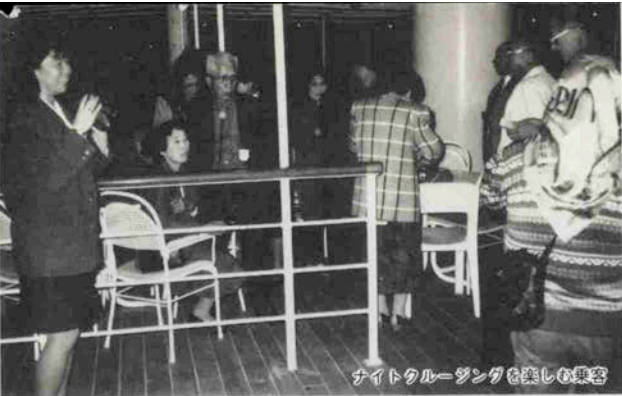
ナイトクルージングを楽しむ乗客