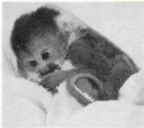
タオルにしがみついて眠る JUN ちゃん

しかし、親に戻して3時間め、最悪のことが起ってしまった。再び母の胸から落ちたこの子は水入れにはまりこみ、ずぶ濡れのところを発見したのです。