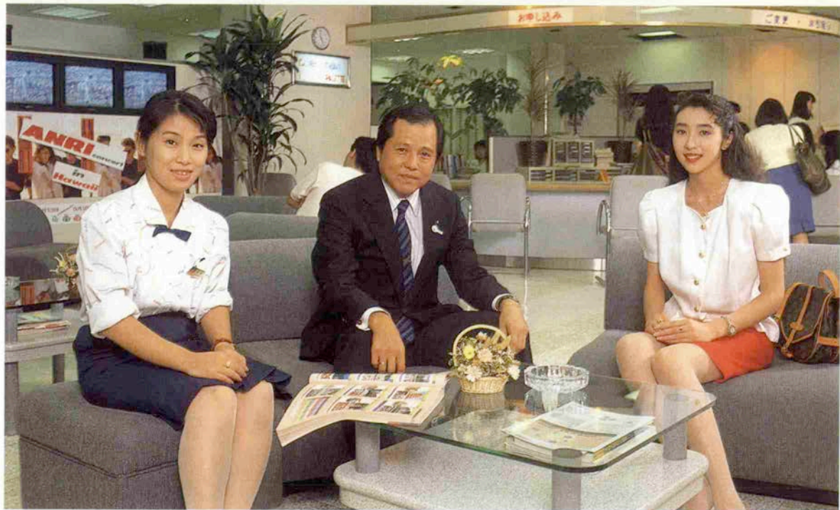
神戸の街に合ったサロン風の神戸三ノ宮支店