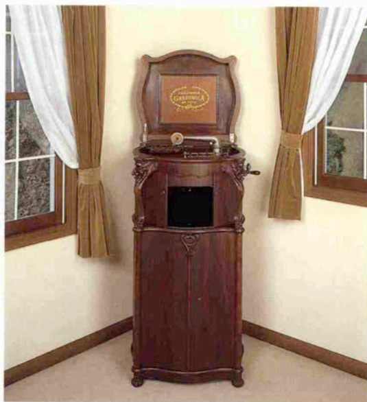
写真/レジーナ レジーナフォーンスタイル No. 240 「コロムビア・グラフィック」 1904年 アメリカ