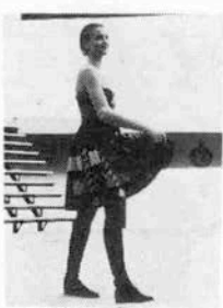
機能的なデザインは 常に着る人が主役

気になる今年の秋の傾向は「クラシック指向」。ベージュ、紺、黒などの落ちついた色使いに、ストライプや千鳥格子の組み合わせ。一見地味なように見えるなかにも、ちょっとしたセンスの良さが現われているのが特徴といえる。ファッションで自己主張したい人におすすめのアイテム。