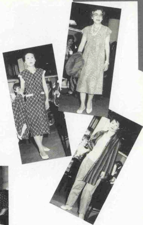
年代物のゆかた、男物のゆかたを仕立てたもの、藍染めなど個性豊かな作品が登場。

きらきらと太陽が照りつける夏を迎えました。私はかねがね和服地の素材をドレスに、ルネッサンスすることを、おすすめして参りました。中でもゆかたに代表される夏の着物は、着心地、肌ざわり、吸湿性が抜群でございます。細くてしなやかな軽い麻地の帷巾、上布、小千谷縮み、木綿では久留米絣や琉球絣等その他各地の絣、又ゆかた、ゆかたの中にも長板藍染め、笠仙、絞り、紅梅等数えるに限りありません。染や織にそれぞれ工夫がなされ、それらに触れるたびに日本の伝統に誇らしさを覚えます。 百年も前の物から新しいものまでが、パンツルック、街着のツーピース、アンサンブル、ロングドレスになり、反物からはスリーピース（ブラウス・スカート・上着・スカート）に仕上ります。そしてこのたび、お教室で仕上げたり、オーダーされた作品を身につけ、それぞれが主役になって、披露するパーティーを開きました。ピアノに乗って歩き、素材に触れたり批評し合ったり、溜息がもれ、思わず拍手が出る楽しい会に終りました。