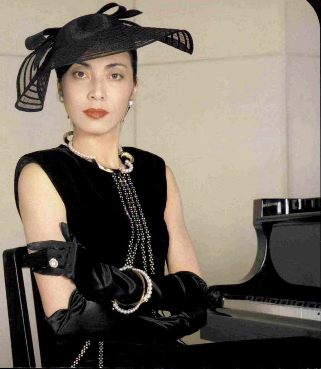
PEARL FANTASY & REY ASAMI