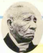
御木本幸吉 (創業者・真珠翁)

明治26年、世界で初めて真珠養殖に成功した御木本幸吉。その95年の信頼と伝統が“ミキモトパール”の美しい輝きの中に息づいています。