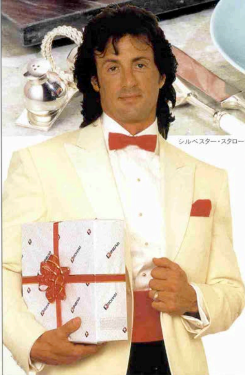
シルベスター・スタローン