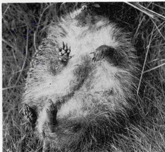
丸まったハリテン君、「もうダメだ…」とばかりに足をくずす