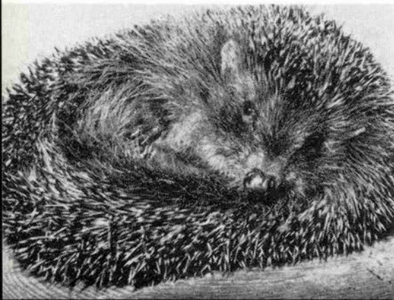
一見ハリネズミのようなハリテン君