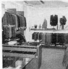
ウネ・セレクション

創業以来41年、神戸のメ ンズ・ハイファッションの リーダー的存在であったウ ネが、新店舗を元町2丁目