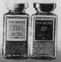
「ザ・ブレンド」シリーズ

のサンブルテイストの中 から選ばれたNo.114と117を そのまま品名にした「ザ・ ブレンド」は型もシンプ ルな角形。毎日飲む「おい しさの基本」を大切にした「 ティステイ・カフェ」満足 のいく味とデザインです。