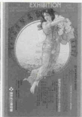
右 / 明治44年、神戸で開催された貿易生産品共進会のポスター（北野恒富原画）を使用した「神戸はじめ物語展」のちらし・ポスター 左 / 同展を見学する二人。

許せないのは魚の化物だ。あれは何だ。造形のまずさと共に、素材の選択のミスからか、最初からすすけた不潔感。レストランのイメージを悪くするばかりである。しかもロケーションとセッティングの悪さは呆れるとしかいいようがない。何か間違っている。金をかけて造ったことは解るが、撤去するのも一つの英断である。これは直接関係ないと思うが、最近の1%文化行政は原則的には歓迎すべきだが、人の造ったものの全てが美しいと