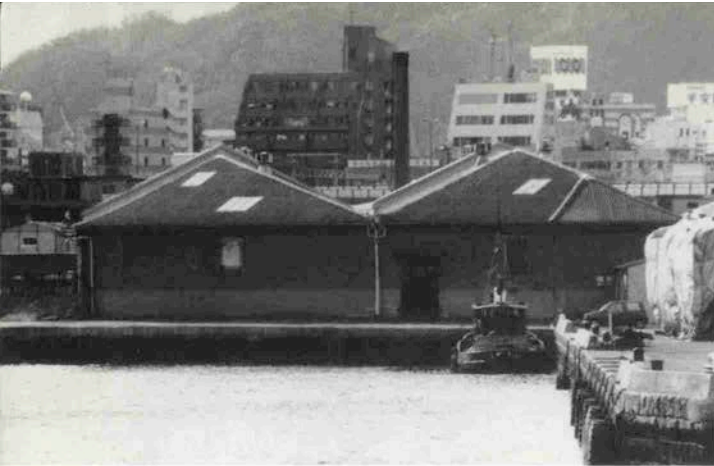
ウォーターフロント（水際）に建つレンガの倉庫