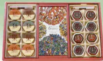
エコレセ・果心庵・三半譜詰合せ<EKS30>3,000円