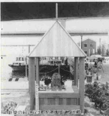
新築の祠に収まったマツケン地蔵