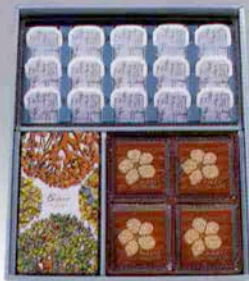
エコレセ・チーゲル・水羊羹詰合せ<EMW50>5,000円