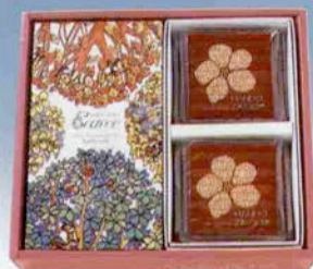
エコレセ・チーゲル詰合せ<EM20>2,000円

この夏は、美味しさと爽やかさを詰合せた、パーソナルギフト。洋菓子・和菓子など心をこめて選んださわやかな甘さのお菓子は、素敵な気分……。お中元、お祝い事やお世話になったあの方へ、ご利用くださいませ。