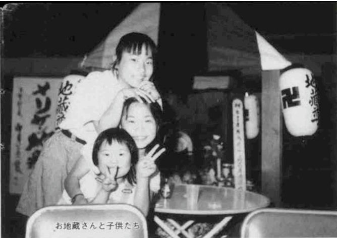
お地蔵さんと子供たち