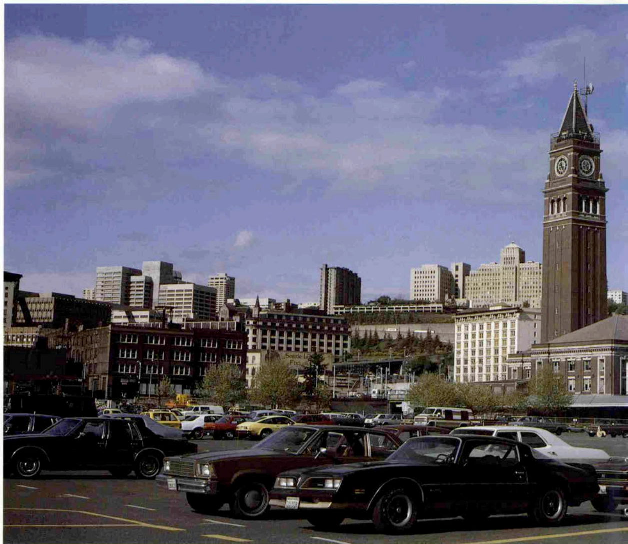
キリングストリートステーション