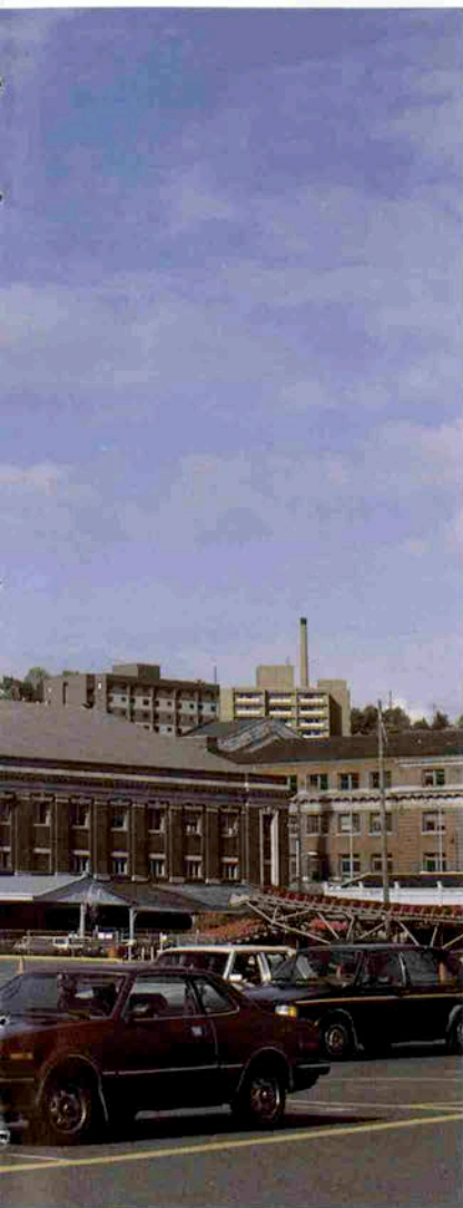
チャールズ・ロイヤーシアトル市長も来神されます。