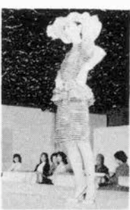
しなやかで女らしいシルエツ

「クチュリエの中のクチュリエ」と呼ぶにふさわしい、エレガントで気品にあふれた作品に加え、快活なシルエット、女らしいほっそりしたシルエツが印象的だ。