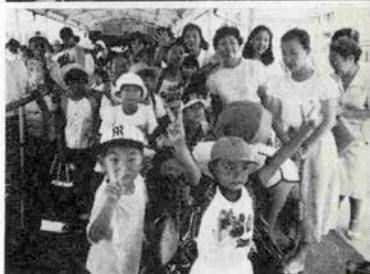
(上) 希望の家の人から石野会長に感謝の花束が (下) 家庭養護協会の里親と里子のボンボコキヤ ンプへの援助で淡路島へ

が責任を持ってやらなければならない。奉仕するだけでなく、勉強する場でもあるのです。