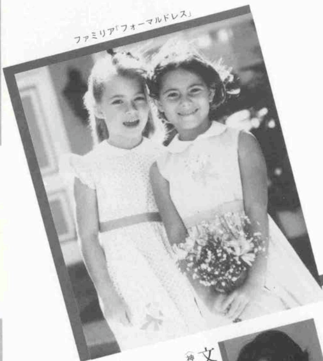
文・鈴木章子 （神戸ドレスメーカー学院 副学院長）