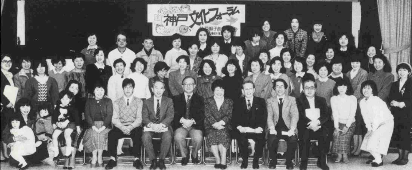
ある集い □ 神戸親子劇場