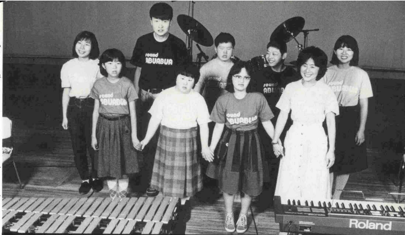
ある集い□楽団あぶあぶあ