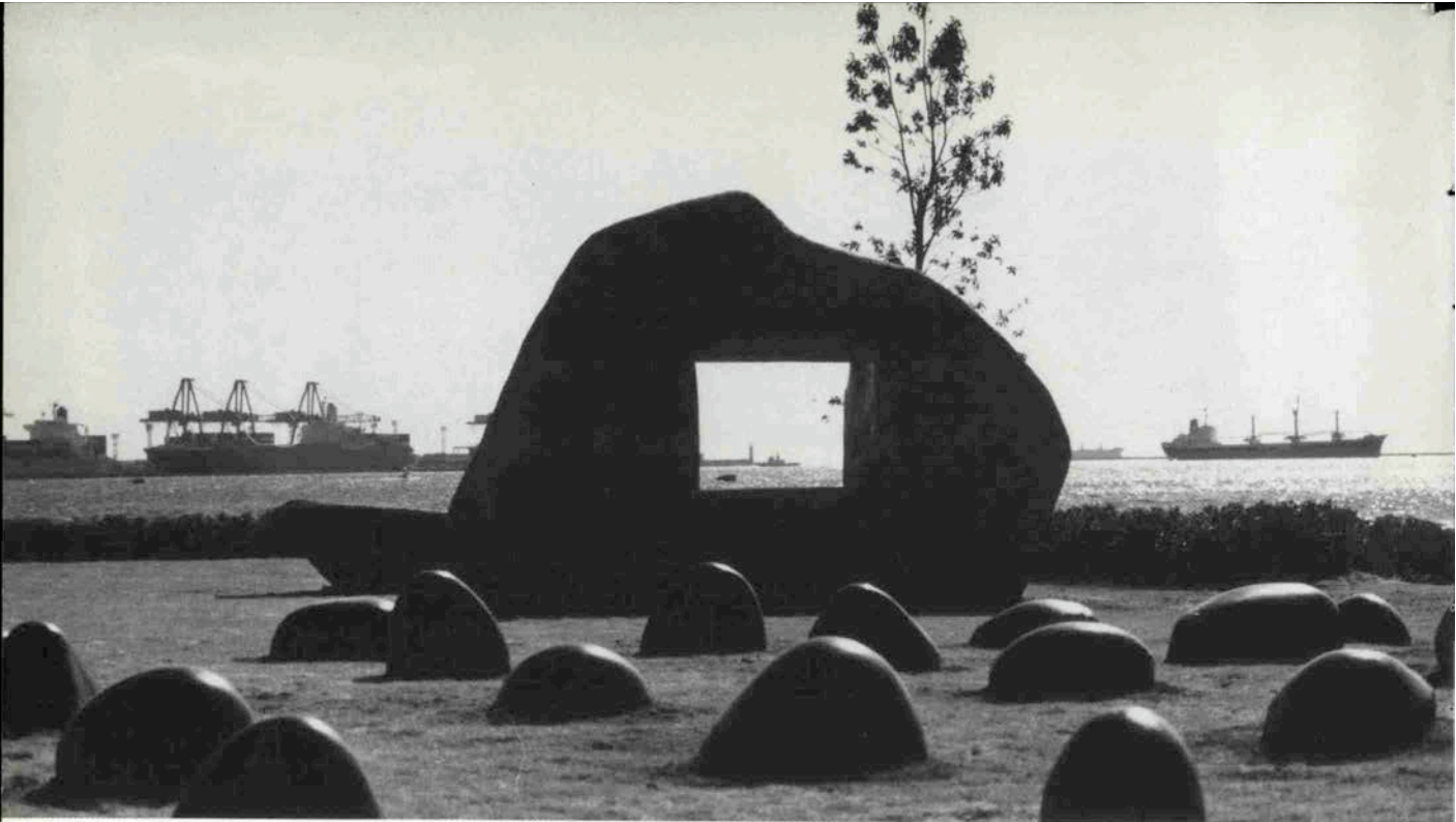
スクリーンの中には海、そして船が…。自然の風景が映画の世界をつくり出す。手前はスターストーン。中央はスクリーン石のメリケンステージ。

神戸・メリケンパークの南端に海を見渡すように立ち並ぶ大小の石。これが映画発祥の地の記念碑「メリケン・ステージ」である。