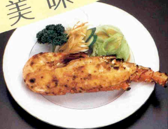
伊勢海老のチーズ焼