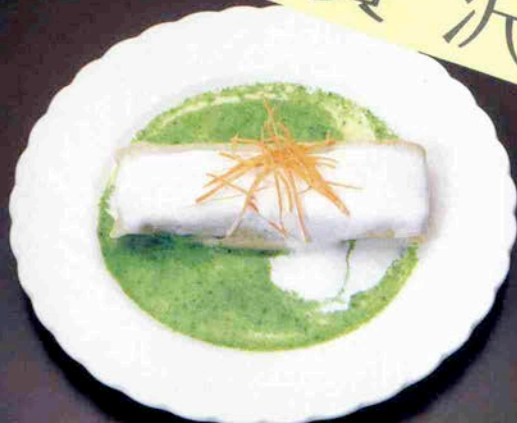
伊勢海老のクレープ

料理のよしあしはその素材で半分以上が決まるといわれています。いいかえれば、どんなに一流の料理人が腕をふるっても鮮度の落ちた素材では、ご満足いただける一品は生まれませんということです。厳しいまでに質をチェックし、鮮度を重視。特別ルートで直送された良質の伊勢海老だけが水槽で出番を待つ。本当によいものと、ベテランの一流コックが奏でるハーモニーが、中納言のおいしさなのです。