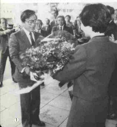
①花束を受けとる貝原知事②中庭に集った職員の拍手に答える③新県政スタートの抱負を語る④宗野出納長の音頭で万歳三唱

11月25日午後、新しく県知事に就任した貝原俊民知事が初登庁し、就任式が行われた。県庁北側玄関に姿をみせた貝原知事は、女子職員の福岡さんから花束を受けとり、にこやかに握手、就任式に臨んだ。「兵庫2001年計画の実現へむけて人間愛の連帯精神を基盤とし、失敗を恐れずチャレンジするさわやかでしなやかな県政を目指そう」と抱負を語り、約2000人の職員の拍手を受けた。午後から公館で坂井知事より事務引き継ぎが行われ、貝原県政がスタートした。