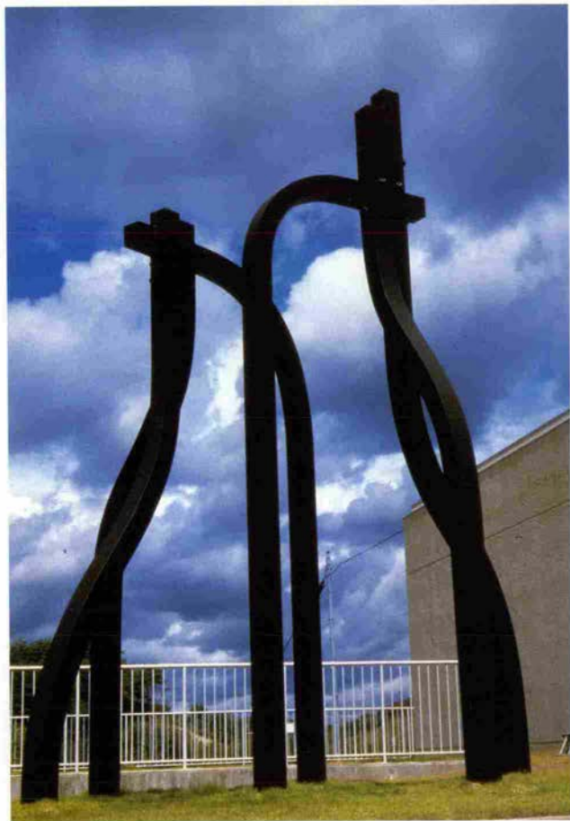
塚脇 淳「地上より」1986年