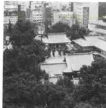
窓からは生田神社の森も一望にできる。

また、「ちよつとグルメしたいけど今は真夜中、外に出るのは怖くて……」というギャルは、24時間営業のカフェ・レストラン「コウベテラス」が迎えてくれる。手頃な値段で一流のフランス料理が味わえ、神戸のナイト