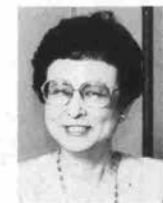
推薦者／田中千佳 （作家）

初対面の時、テキパキした頭の良いお嬢さんだと思いました。それだけでなく、親しくなるにつれ、さりげない優しい心遣いをして下さって、すっかり好きになりました。英語の他にスペイン語もご堪能です。ご覧のような美人の上に、お料理もお得意とか。こんな素敵なお嬢さんを一人占め出来る憎い男性はどこの誰方なのでしょう？きっと背の高いハンサムが現れるのでしょうか。幸せになって下さい。少し誉め過ぎたかな、アア、シンド。