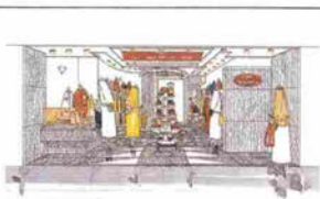
国鉄芦屋駅前ラポルテ2F 11月1日オープン!!