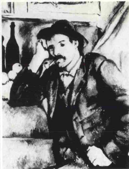
パイプの男 / エルミタージュ美術館 1895~1900年

よって切り開かれた二十世紀美術の源流にセザンヌが位置していることを確認させるだけでなく、セザンヌ芸術とセザンヌ個人の生活史との関連にも新たな照明をあててくれるでしょう。