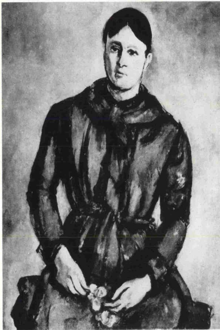
セザンヌ夫人 / サンパウロ美術館 1890~1894年